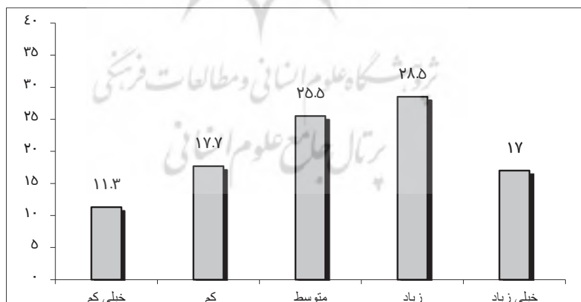
نمودار ۲. توزیع پاسخگویان بر حسب دینداری