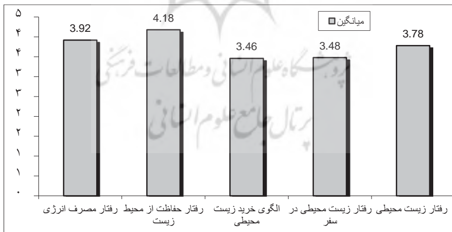
نمودار ۱. توزیع پاسخگویان بر حسب الگوهای رفتار زیست محیطی

بررسی توزیع پاسخگویان بر حسب رفتار زیست محیطی زنان نشان می‌دهد که الگوی رفتار مصرف انرژی در بین ۲۷,۵ درصد در حد کم، ۲۰ درصد متوسط و ۵۲/۵ درصد در حد زیاد بوده و میانگین رفتار مصرف انرژی ۳/۹۲ است. الگوی رفتار حفاظت از محیط زیست در بین ۲۶ درصد در حد کم، ۱۹/۲ درصد متوسط و ۴۷/۸ درصد در حد زیاد بوده و میانگین خصوصیت رفتار حفاظت از محیط زیست برابر با ۴/۱۸ است. خصوصیت رفتار زیست محیطی در سفر در بین ۳۵,۶ درصد در حد کم، ۳۲,۵ درصد متوسط و ۳۲ درصد در حد زیاد بوده و میانگین رفتار زیست محیطی در سفر برابر با ۳/۴۶ است. الگوی خرید زیست محیطی در بین ۳۱ درصد در حد کم، ۳۰/۷ درصد متوسط و ۳۸/۳ درصد در حد زیاد بوده و میانگین الگوی خرید زیست محیطی برابر با ۳/۴۸ است.