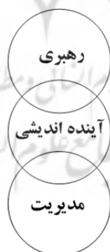
شکل ۲: ارتباط آینده‌اندیشی، رهبری و مدیریت (کرامت زاده، ۱۳۹۵)

۲) بر مبنای رویکرد کیفی با روش آینده‌پژوهی تعبیری ۲ با استدلال استعاری و استعاره پردازی می‌باشد به صورتی که با تبیین آینده‌پژوهی آینده‌های محتمل و ممکن رویکرد ایرانی مبتنی بر مضامین تحول‌خواهی و تجدیدشوندگی همگام با تحولات علم مدیریت دولتی مورد توجه قرار می‌گیرد. آینده‌اندیشی در ارتباط رهبری و مدیریت، دارای نقش هم‌راستا ساز و همگرا ساز است.