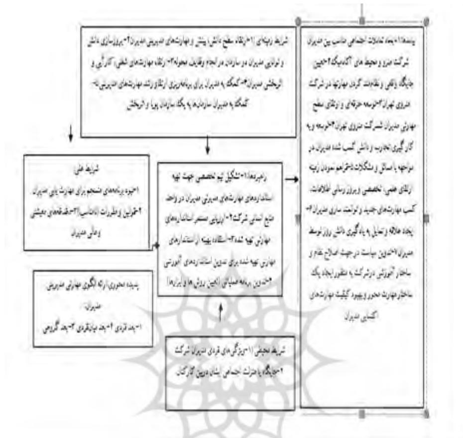
شکل ۴. الگوی پارادایمی مستخرج از رهیافت نظام‌مند (اشتراوس و کوربین)

اعتبارسنجی الگوی پارادایمی: رویی و پایایی الگوی پارادایمی: با توجه به مفاهیم ذکر شده در این پژوهش از روش اجماع سه‌سویه (اجماع داده‌ها اجماع پژوهشگران و اجماع تئوری‌ها و اجماع روش‌شناسی) بهره بردیم. روش‌های مثلث‌سازی برای تحقیقات کیفی عبارت‌اند از: الف) مثلث‌سازی منابع داده‌ها: به استفاده از منابع متعدد داده‌ها در مطالعه، مانند مصاحبه با پرستاران و بیماران، پیرامون یک موضوع یکسان اطلاق می‌شود. ب) مثلث‌سازی محقق: بکار گرفتن بیش از یک پژوهشگر برای جمع‌آوری، تجزیه، تحلیل یا تفسیر داده‌ها می‌باشد. ج) مثلث‌سازی نظریه، تئوری: استفاده از دیدگاه‌های متعدد برای تفسیر داده‌هاست. د) مثلث‌سازی روش: استفاده از روش‌های متعدد برای جمع‌آوری داده‌ها مانند مصاحبه و مشاهده است (اسکریم