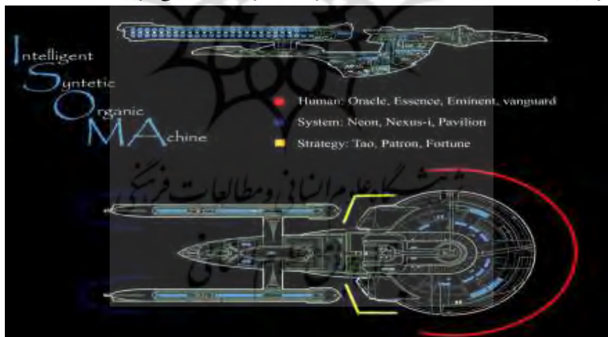
شکل ۱. طرحواره سازمان قرن بیست و یکم به صورت ماشین ارگانیک سنتزی هوشمند

نیازمند شناخت مهارت‌های مدیریتی هستند تا زمینه مناسب برای کارآمد شدن آنها فراهم آید (دعائی و مرتضوی، ۱۳۸۴). توسعه مدیران صنعتی برای حضور در عصر جهانی شدن یکی از ضروریات کشور ماست. به قول برخی محققین، مدیران باید بفهمند که جهانی‌سازی تأثیرات متفاوتی بر مردم و کشورها دارد (اسوانسون و هولتون، ۲۰۰۹). ۱ ارزش مهارت‌های مدیریتی مدیران در سازمانها: امروزه یکی از مزیت‌های نسبی، مهم و اساسی سازمان‌ها در محیط رقابتی و نامطمئن، عامل مدیریت آنهاست. با توجه به این که در دنیای کنونی در پشت هر ماشین بزرگ اقتصادی نام یک مدیر به چشم می‌خورد (کوالسکی، ۲۰۱۴). ۲ به عنوان مثال: در مدل ایزوما هر سازمان به یک ماشین ارگانیک سنتزی هوشمند (ایزوما ۳ ) با چهار رکن زیر مدل‌سازی می‌شود (رشیدآباد، ۱۳۹۵). ۱ - هدف / مأموریت، ۲- آگاهی / دانش و اطلاعات، ۳- کاربری / سطوح عملیات، ۴- انسان / انگیزه و خلاقیت. از این منظر، هر ایزوما در سه بعد در بخشی از یک طیف تکاملی ۱۰ مرحله‌ای قرار می‌گیرد. حرکت این ماشین نیز بر بستر بعد چهارم یعنی زمان سنجیده می‌شود. طرحواره این ماشین در شکل ۱ نمایش داده شده است، با نگاهی به این طرحواره اهمیت و جایگاه مهارت‌های مدیریت مدیران آشکار می‌گردد.