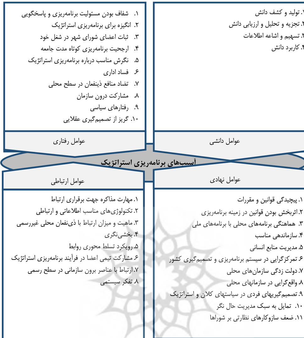
نمودار ۲. مدل پژوهش

بعد از ارائه مدل در قسمت کیفی پژوهش، نیاز به غربال‌گری و شناسایی شاخص‌های نهایی پژوهش است. برای غربال شاخص‌ها و شناسایی شاخص‌های نهایی از رویکرد دلفی فازی استفاده شده است. برای سنجش اهمیت شاخص‌ها از دیدگاه خبرگان استفاده شده است. اگر چه افراد خبره از شایستگی‌ها و توانایی‌های ذهنی خود برای انجام مقایسات استفاده می‌نمایند، اما باید به این نکته توجه داشت که فرآیند سنتی کمی سازی دیدگاه افراد، امکان انعکاس سبک تفکر انسانی را به‌طور کامل ندارد.