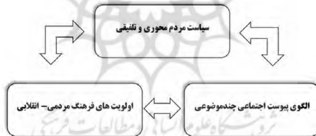
شکل ۱: شبکه‌ی مضمونی مسأله‌شناسی فرهنگی در سازمان فرهنگی تفریحی شهرداری مشهد