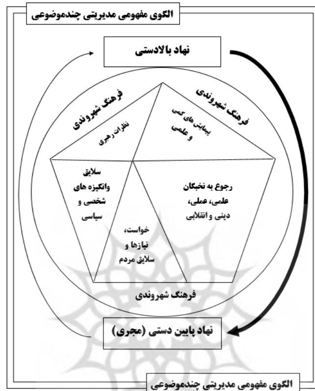
شکل (۴): الگوی مسأله‌شناسی فرهنگی در سازمان فرهنگی، اجتماعی، ورزشی