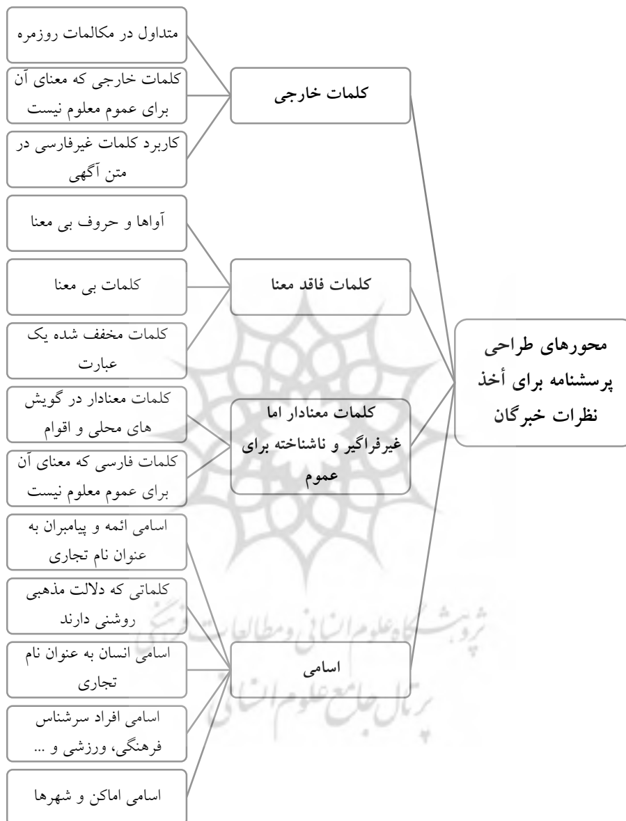
شکل (۱): چارچوب بررسی ابعاد زبانی نام‌های تجاری محصولات ایرانی