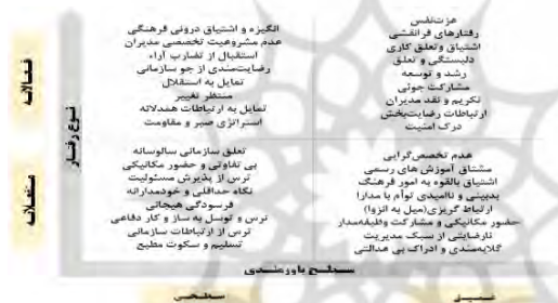
شکل ۵: عبارات مفهومی بر اساس نوع رفتار و سطح باورمندی

پژوهش حاضر با هدف کشف و شناسایی علل مکنون در نوع رفتار سازمانی کارکنان خشنود سازمان‌های فرهنگی بر اساس سطح باورها و نوع رفتار انجام پذیرفت. به‌منظور دستیابی به این هدف، ابتدا نمونه‌ها به کمک تکنیک گونه‌شناسی تفریدی، تفکیک و سپس با افراد شاخص هر طبقه مصاحبه شد. جایگاه نمونه‌ها بر اساس طیف باورمندی و نوع رفتار بر اساس داده‌های کمی در شکل ۴ و وضعیت دموگرافیک آن‌ها در جدول ۸ قابل مشاهده است. همچنین، عبارت مفهومی فاز کیفی پژوهش به تفکیک نمونه‌های چهارگانه در جدول ۱۰ و بر اساس رفتار معطوف به گروه نیازها در جدول ۱۱ قابل مشاهده است. تجمیع عبارات مهم مصاحبه‌ها بر اساس سؤال اول پژوهش روی بردار سطح باورمندی و بر اساس سؤال دوم تحقیق روی بردار نوع رفتار در شکل ۵ ارائه شده است.