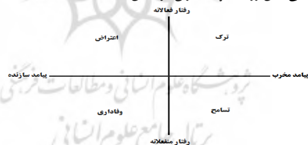
شکل ۱: رفتار سازمانی کارکنان بر اساس نوع رفتار فعال / منفعل و آثار مخرب / سازنده

بر اساس این مدل، رفتار کارکنان در ساختارهای استبدادی، مراقبتی، حمایتی، مشارکتی و سیستمی به‌گونه‌ای خواهد بود که بر پایه پارادوکس رز بلت و همکاران ۳ (1988) منجر به بروز نوع ویژه‌ای از رفتار می‌شود. این رفتارها بازتاب فراترکیبی از میزان خشنودی کارکنان در سلسله‌مراتب نیازهای مزلو بوده و در دو بعد فعال / منفعل و سازنده / مخرب شکل خواهند گرفت. ابعاد و نتایج اقتباسی مدل رز بلت و همکاران در شکل ۱ آمده است.