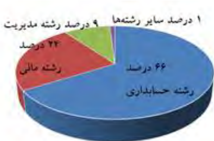
تمودار ۴، شماره رشته تحصیلی پاسخ‌دهندگان