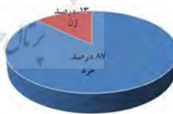
نمودار ۱. نمودار دایره‌ای جنسیت پاسخ‌دهندگان