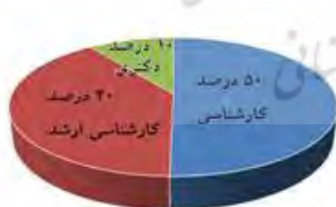
نمودار ۲. نمودار دایره‌ای مقطع تحصیلی پاسخ‌دهندگان

در مورد مشخصات پاسخ‌دهندگان نیز لازم به ذکر است که اکثر پاسخ‌دهندگان دارای مدرک کارشناسی، فارغ‌التحصیل رشته حسابداری، مرد و دارای کمتر از پنج سال تجربه بوده‌اند. نمودار دایره‌ای مشخصات پاسخ‌دهندگان در نمودارهای ۱، ۲، ۳ و ۴ آمده است.