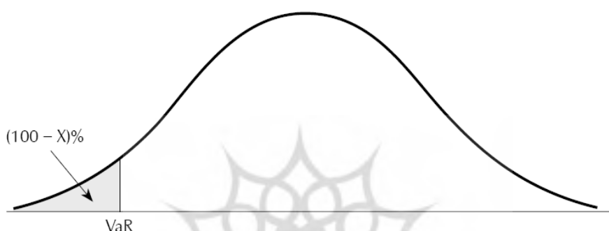
شکل ۱- جایگاه توزیعی ارزش در معرض خطر

۱) به عبارت دیگر VaR برآوردی از سطح زیان روی یک سبد سرمایه‌گذاری که به احتمال معین کوچکی (در اینجا ۵٪) پیش‌بینی می‌شود با آن مساوی شود و یا از آن تجاوز کند.