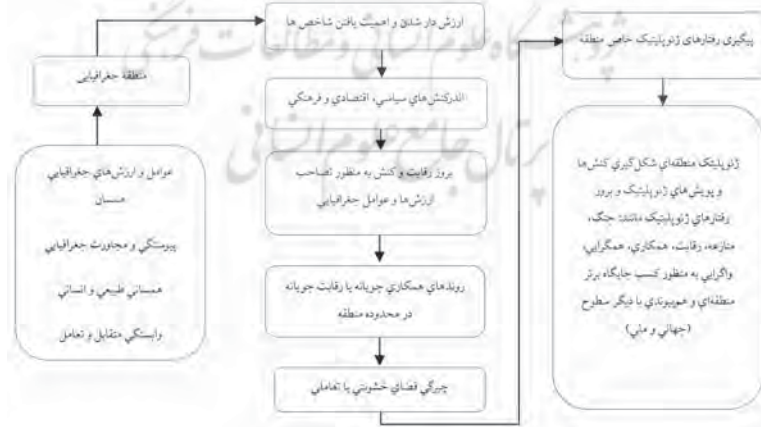
مدل ۱. هم‌پیوندی منطقه، منطقه ژئوپلیتیک و ژئوپلیتیک منطقه‌ای

قدرت‌ها از وضعیتی ویژه که منافع خود و متحدانش را در تحقق آن می‌بیند، سبب ایجاد دسته‌بندی‌های متفاوت و متعارض منطقه‌ای می‌شود که نتیجه آن بروز رقابت‌های منطقه‌ای است. اضافه شدن هر بازیگر در منطقه، تعدد ذی‌نفعان منطقه‌ای را به دنبال می‌آورد. هرچه تعداد ذی‌نفعان در مسائل منطقه‌ای بیشتر باشد، احتمال رسیدن به تفاهم به همان نسبت پایین‌تر می‌آید. همچنین دخالت قدرت‌های بزرگ موجب پیچیده‌تر شدن کنش‌های منطقه‌ای و مانع ایجاد تفاهم میان کشورهای منطقه می‌شود. این امر ضمن آنکه به شکل‌گیری شکاف‌های منطقه‌ای منجر می‌شود، سبب تداوم و استمرار اختلافات و منازعات منطقه‌ای و در نتیجه ایجاد بی‌ثباتی و ناامنی می‌شود (Ghasemi & Nazeri, 2012: 144). با توجه به مزیت‌ها و محدودیت‌های ژئوپلیتیک و شناخت دقیق فرصت‌های بالقوه و بالفعل موجود، رفتارهای ژئوپلیتیک خاصی در مناطق شکل می‌گیرد. چنین رفتارهایی، مبنایی برای ژئوپلیتیک منطقه‌ای هستند. در منطقه ژئوپلیتیک با توجه به وزن ژئوپلیتیک بازیگران، مرزهای کنش آن‌ها دچار انقباض و انبساط می‌شود. مدل ۱ هم‌پیوندی میان منطقه، منطقه ژئوپلیتیک و ژئوپلیتیک منطقه‌ای را نشان می‌دهد. ساختار روابط ژئوپلیتیک منطقه‌ای تابعی از جایگاه ژئوپلیتیک آن‌ها در منطقه و سطح قدرت ملی آن‌ها نسبت به یکدیگر است. در واقع به لحاظ نظری، الگوی ژئوپلیتیک منطقه‌ای به صورت سلسله‌مراتبی تنظیم می‌شود. دولت‌های قدرتمند منطقه، بازیگران یا قدرت‌های سطح اول نظام را تشکیل می‌دهند و دیگر کشورها و دولت‌ها، بسته به سطح قدرت ملی آن‌ها در سطوح پایین‌تر قرار می‌گیرند (Hafeznia and kavianirad, 2012: 104).