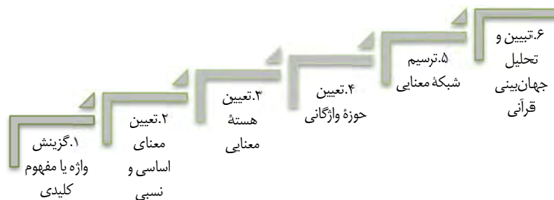
نمودار ۱: فرایند معناشناسی واژگان کلیدی