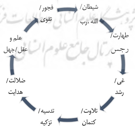
نمودار ۲: تقابل واژگانی تربیت

در پیوستار دیگر قرآنی (شمس، ۷-۱۰) با محوریت نفس (جسم و روح)، مفاهیمی چون تقوی، فلاح و تزکیه، در تقابل آشکار با فجور، خیبت و تدسیه به کار رفته است. رستگاری از آن کسی است که نفس خویش را تربیت کند و رشد و نمو دهد، وگرنه آن کس که نفس خویش را با معصیت و گناه به پستی کشانده، ناامید و محروم گشته است: «وَقَدْ خَابَ مَنْ دَسَّاهَا» واژه «خاب» نقطه مقابل «فلاح» به معنای شکست خوردن و در ماندن است (راغب اصفهانی، پیشین، ص ۳۰۰).