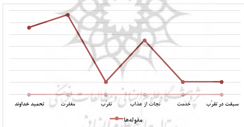
نمودار ۱. فراوانی مقوله‌ها

مقوله‌بندی فوق به این معناست که هر فراز و جمله‌ای از دعای کمیل، ذیل یکی از شش مقوله مزبور جانمایی می‌شود. فراوانی این مقوله‌ها در نمودار ذیل ترسیم شده است: