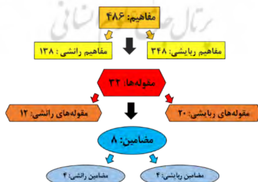
شکل ۱. مراحل طبقه‌بندی یافته‌های پژوهش؛ مربوط به سؤال ۱

باتوجه به هدف پژوهش و جهت دستیابی به نگرش و کشف لایه‌های ذهنی مخاطبان زیست‌نامه شهدا، با انجام مصاحبه با طیف وسیعی از مخاطبان جوان و دانشجو، فهرستی مشتمل بر ۴۸۶ مفهوم، ۳۲ مقوله و هشت مضمون استخراج و طبقه‌بندی گردید که در جداول شماره ۲ و ۳ ارائه گردیده است.