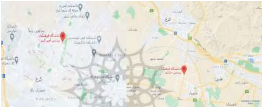
شکل ۱: موقعیت جغرافیایی دو پردیس در شهرستان کرج

دانشگاه فرهنگیان استان البرز در دو پردیس حکیم فردوسی برادران و امیرکبیر خواهران از سال ۱۳۹۱ به طور مستمر در حوزه آموزش جغرافیا و جذب و تربیت دانشجومعلم اهتمام دارد. از این رو از سال ۱۳۹۱ تا ۱۳۹۹ دانشجومعلمان علاقه‌مند، در دو پردیس به صورت جداگانه مورد پذیرش واقع شده و آموزش‌های لازم توسط گروه علوم انسانی و اجتماعی به آن‌ها ارائه گردیده است. پردیس برادران در جاده ملارد و پردیس امیرکبیر در بلوار باغستان کرج واقع شده‌اند که ۳۶ استاد تخصصی در گرایش‌های مختلف جغرافیا وظیفه آموزش را در آن‌ها بر عهده دارند.