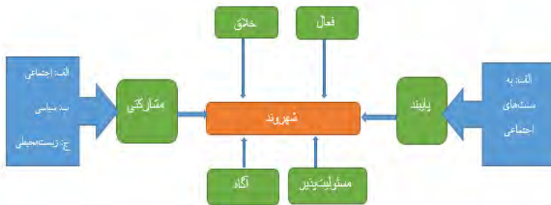
نمودار ۳: مدل مفهومی شهروندی

بر مبنای این مدل، شهروند مطلوب با مؤلفه‌ها و ویژگی‌های اصلی چون مشارکتی (با محورهای فرعی سیاسی، اجتماعی، زیست‌محیطی)، خلاق، فعال، پایبند (با محورهای فرعی دینی و پایبندی به سنت‌های اجتماعی)، مسئولیت‌پذیر و آگاه شناخته می‌شود. در دوران معاصر هر کنشگر فردی و اجتماعی که برخوردار از چنین ویژگی‌ها و مهارت‌هایی باشد می‌توان گفت که شهروند واقعی و ایده‌آل است. هرچند که بخشی از این حوزه‌ها مانند پایبندی دینی عمومیت کمتری در جوامع امروز دارند.