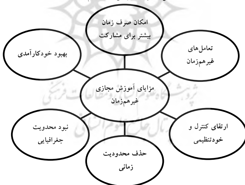
شکل ۲ مزایای آموزش مجازی غیرهم‌زمان

محدودیت‌های زمان و مکان در بین شبکه‌های مردم استفاده می‌کند. یادگیری الکترونیکی ناهم‌زمان از ارتباط واسطه‌ای رایانه‌ای