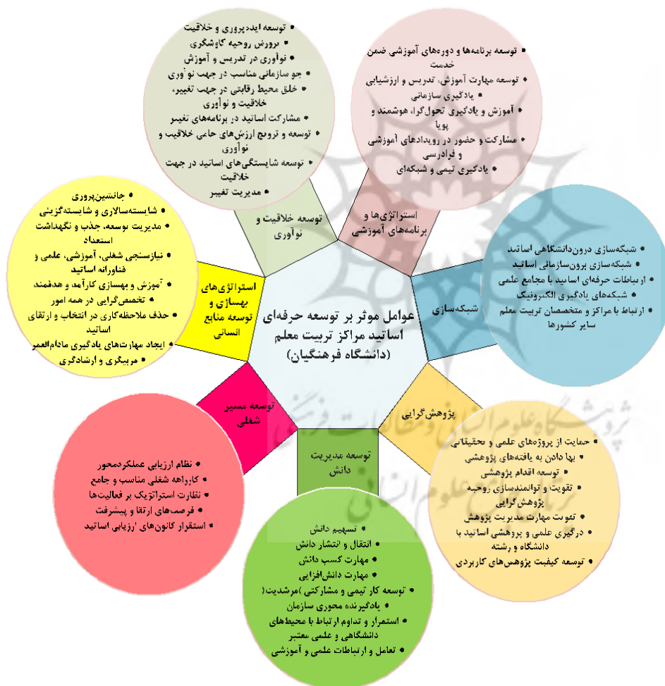
شکل ۳: نمودار گرافیکی عوامل مؤثر بر توسعه حرفه‌ای اعضای هیئت علمی دانشگاه فرهنگیان

سپس در قسمت کمی و به روش تحلیل عاملی تأییدی، اعتبار مدل طراحی شده مورد تحلیل قرار گرفت. لذا روایی سازه که برای بررسی دقت و اهمیت نشانگرهای انتخاب شده برای اندازه‌گیری سازه‌ها، انجام شد نشان داد که نشانگرهای متغیرهای پژوهش، ساختارهای عاملی مناسبی را جهت اندازه‌گیری ابعاد مورد مطالعه در مدل پژوهش فراهم می‌آوردند. بنابراین با توجه به برازش مناسب مدل و نتایج بدست آمده از نتایج کیفی و کمی پژوهش مدل نهایی شده طور شماتیک در شکل زیر مشاهده می‌شود.