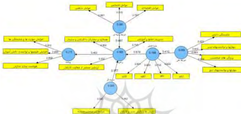
شکل ۱. مدل کلی پژوهش با تکنیک حداقل مربعات جزئی