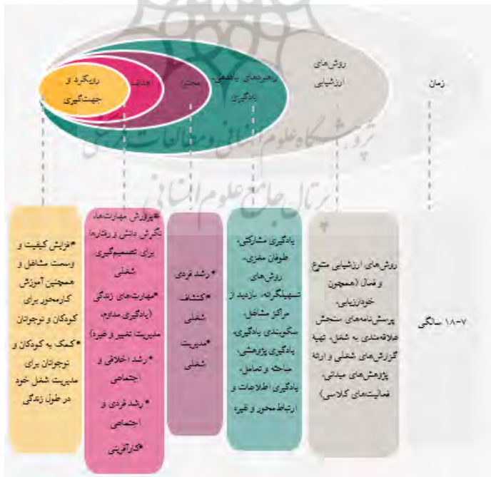
شکل ۲. خلاصه نتایج بررسی شده و تحلیل عناصر برنامه‌های درسی هدایت شغلی

با هدف شناسایی و بررسی برنامه‌های درسی هدایت شغلی موجود در جهان انجام شد. نتایج جست‌وجوها نشان داد برنامه‌های درسی هدایت شغلی گوناگونی در کشورهای مختلف جهان وجود دارد که با عناوین گوناگون طراحی و در حال اجرا هستند. بررسی اولیه این برنامه‌های درسی نشان داد هریک از آنها اهداف و کارکردهای مشترکی دارند، از جمله کمک به دانش‌آموزان برای پرورش مهارت‌های یادگیری و بین‌فردی، و توانمندساختن دانش‌آموزان به منظور بررسی فرصت‌های شغلی و مسیرهای رسیدن به آنها. در ادامه، به منظور بررسی دقیق‌تر ابعاد و ویژگی‌های این برنامه‌ها به تشریح و مقایسه عناصر اهداف، محتوا، راهبردهای یاددهی-یادگیری و ارزشیابی در دو نوع از برنامه‌های درسی هدایت شغلی مربوط به نظام آموزشی کشورهای انگلستان و استرالیا پرداخته شد. بررسی و تحلیل عناصر برنامه درسی مشاغل و آموزش کارمحور و برنامه درسی شغلی ویکتوریا حاکی از تجارب ارزشمند کشورهای انگلستان و استرالیا در زمینه طراحی و اجرای برنامه‌های درسی هدایت شغلی بود. در ادامه، خلاصه نتایج بررسی و تحلیل هریک از عناصر برنامه‌های درسی در شکل ۲ آمده است، و در پایان بر اساس تبیین هریک از آنها پیشنهادهایی برای نظام آموزش و پرورش کشور ایران ارائه می‌شود.