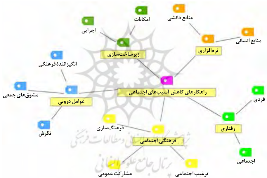
شکل ۲. مؤلفه‌های استخراج‌شده راهکارهای کاهش آسیب‌های اجتماعی در دانش‌آموزان با تأکید بر اوقات فراغت (نمودار درختی نرم‌افزار Max QDA نسخه Pro)

بنابراین نتایج حاصل از ۱۳ مصاحبه انجام‌شده، از طریق کدگذاری باز و محوری (با استفاده از نرم‌افزار Max QDA نسخه Pro)، نشان داد که ۵ مقوله اصلی زیرساخت‌سازی، عوامل درونی، فرهنگی اجتماعی، نرم‌افزاری و رفتاری از مؤلفه‌های اصلی راهکارهای کاهش آسیب‌های اجتماعی در دانش‌آموزان، با تأکید بر اوقات فراغت، است (شکل ۲). در این پژوهش، از کدگذاری انتخابی (گزینشی) استفاده نشد، چراکه ارتباط هیچ‌یک از کدهای محوری با یکدیگر از اهداف پژوهش حاضر نبود و صرفاً شناسایی کدهای باز و محوری از اهداف بود. در ادامه از طریق نرم‌افزار SPSS به تحلیل ویژگی‌های جمعیت‌شناختی نمونه‌های پژوهش و سپس به تحلیل نتایج حاصل از جمع‌آوری پرسش‌نامه‌ها با استفاده از نرم‌افزار Smart PLS پرداخته شد و به سؤال‌های پژوهش پاسخ داده شد.