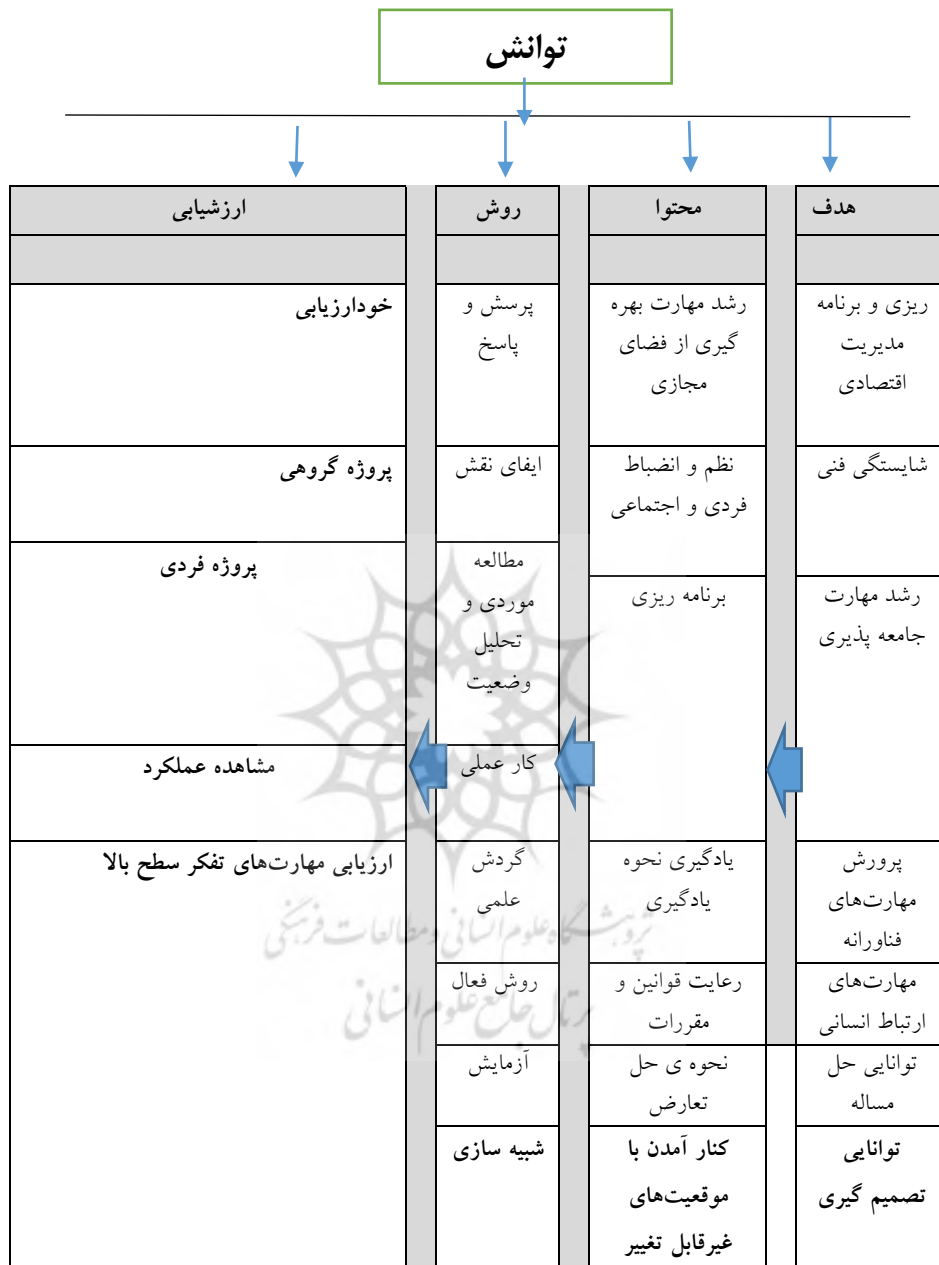
شکل ۳: الگوی مولفه‌های مرتبط به توانش