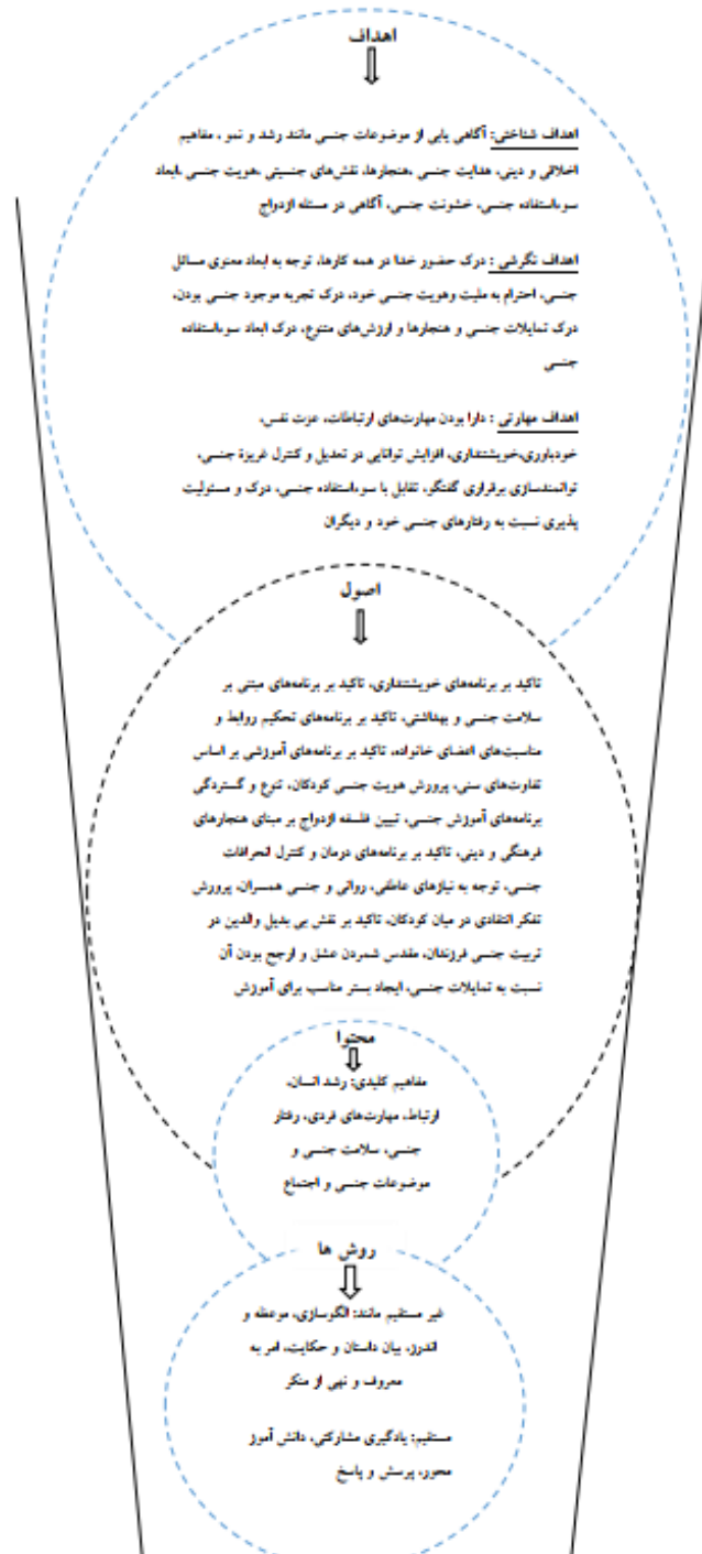
شکل ۲: الگوی جامع تربیت جنسی در ایران بر مبنای برنامه جامع آموزش جنسی (CSE)