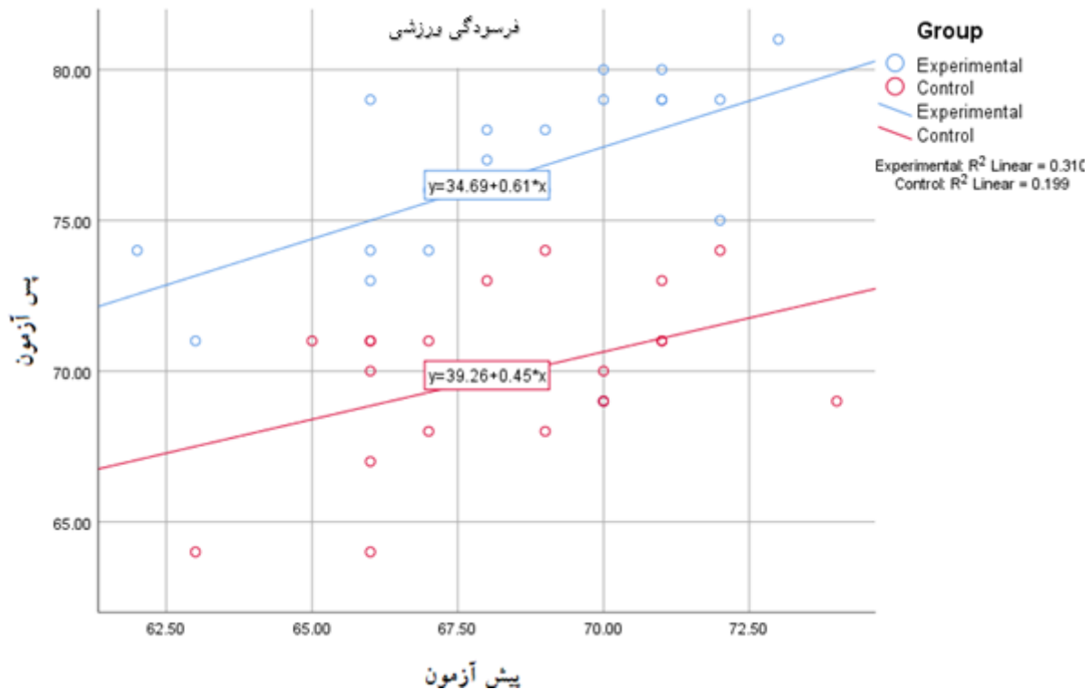
نمودار ۲: پراکنش بررسی رابطه خطی بین متغیر کمکی و متغیر وابسته