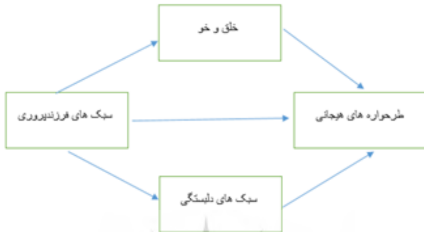
شکل ۱. مدل فرضی پژوهشی برگرفته از مطالعات پیشین

نقش واسطه‌ای را در ارتباط با طرحواره‌های ناسازگار با سبک‌های فرزندپروری دانشجویان داشته باشد؟ همچنین فرضیه‌های این پژوهش عبارتند از: فرضیه اول: سبک‌های فرزندپروری بر طرحواره‌های ناسازگار