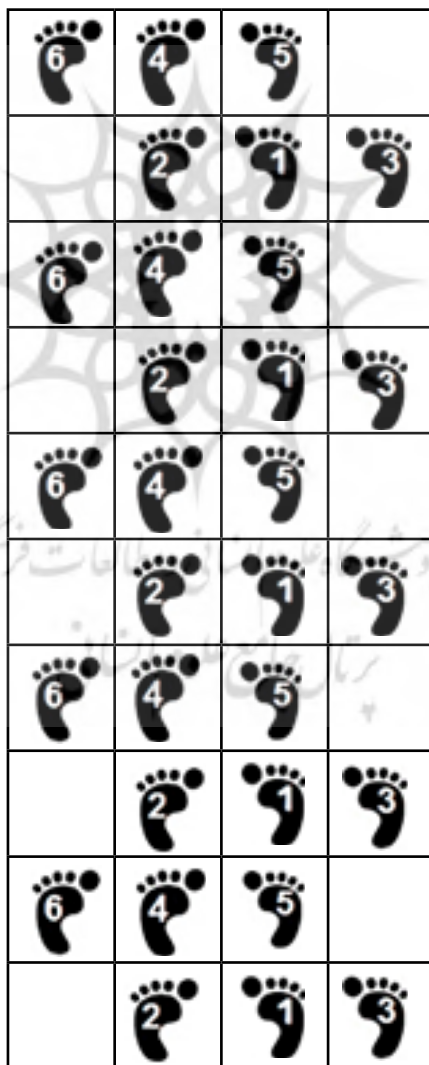
الگو شماره ۷