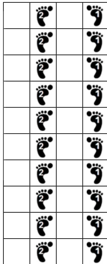
الگو شماره ۵

شکل ۱. نمونه‌هایی از انواع الگوهای مربوط به تمرینات مربع گام‌برداری در سه سطح مبتدی، متوسط و پیشرفته. پاهای راست و چپ بر روی اعداد زوج و فرد قرار می‌گیرند (برگرفته از تمرینات، ۲۰۰۶، Shigematsu).