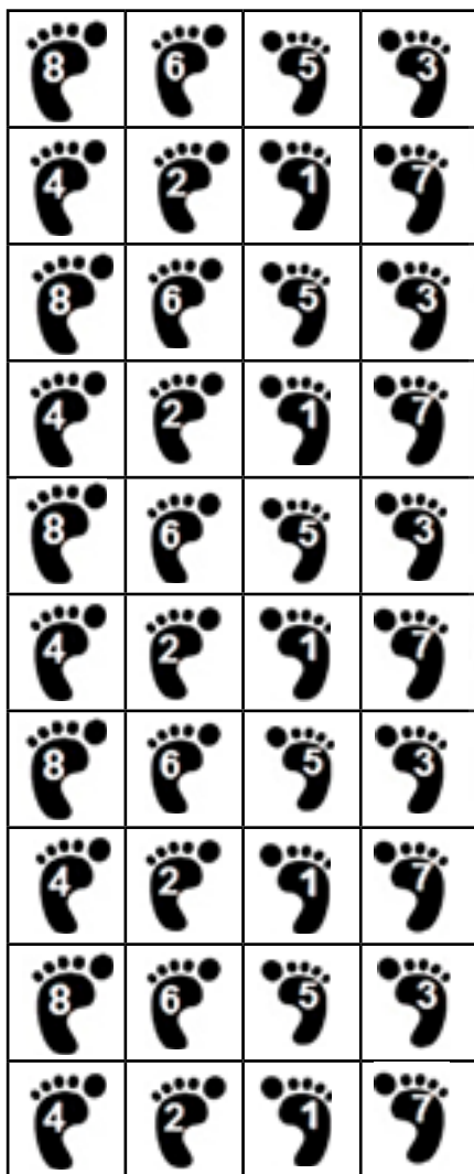
الگو شماره ۲۵