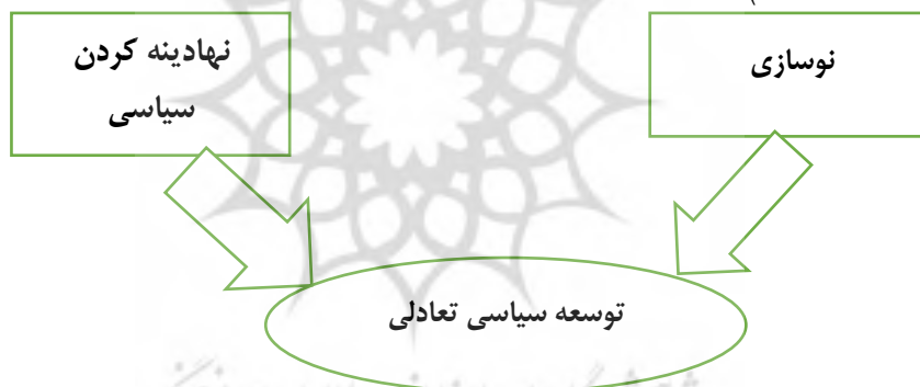
شکل ۱. مدل کلی توسعه سیاسی تعادلی

می‌داند. او نوسازی سیاسی را جزو فرایند افزایش متغیرهای عملیاتی یک حکومت می‌داند و در این رابطه از سه متغیر نام می‌برد: ۱) جهت‌گیری عقلایی ۲) تفکیک ساختاری ۳) قابلیت. وی همچنین نهادینه کردن سیاسی را نیز فرایند افزایش متغیرهای مشارکتی یک حکومت می‌داند و از سه متغیر ۱) جابه‌جایی سیاسی ۲) یکپارچگی سیاسی ۳) نمایندگی سیاسی استفاده می‌کند که این متغیرها خود به اجزایی تقسیم شده و شاخص‌هایی را برای اندازه‌گیری به وجود می‌آورند. او با وصل کردن دو جزء اصلی نهادینه کردن و نوسازی به یکدیگر شبکه‌های مناسبی را برای تجزیه و تحلیل سیستم‌های سیاسی فراهم آورده است. به نظر وی لازمه توسعه سیاسی وجود تعادل مناسب بین آن‌ها است. عدم تعادل (در حالت بالا بودن سطح نوسازی و پایین بودن سطح نهادینه کردن) سیستم سیاسی را به استفاده از شدت عمل و زور ناگزیر می‌کند. برعکس، عدم تعادل (در حالت بالا بودن سطح نهادینه کردن و پایین بودن نوسازی) بر قابلیت سیستم سیاسی اثر می‌گذارد. «توسعه سیاسی تعادلی» ۱ روش جامعی برای حفظ و رشد متوازن ساختارها، نهادها و سازمان‌ها در کنار سایر ابعاد توسعه هم‌چون توسعه اقتصادی، سیاسی و اجتماعی است. (هدی، ۱۳۹۴: ۱۵۲-۱۵۰)