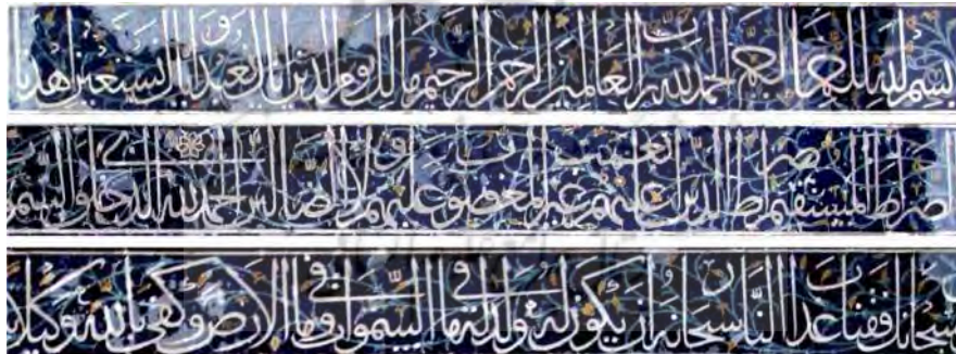
تصویر ۵. کتیبه‌های پایه‌های شبستان، بالا و وسط: پایه تحمید، پایین: پایه تسبیح

در گوشه طاق‌های چهاربخشی شرقی و غربی راهرو شمالی آیه ۱۷۳ سوره آل عمران نگاشته شده است که البته بجای کلمه حَسْبُنَا (کافی است خداوند ما را)، حسبی (کافی است خداوند مرا) نوشته شده است. این آیه از توحیدی‌ترین آیات قرآن بوده و نشان‌دهنده ایمان راسخ ذاکران آن است در اینکه اکتفای ما به خدا به حسب ایمان است نه به حسب اسباب خارجی، که سنت الهیه آن را جاری ساخته است. (طباطبایی، ۱۳۸۶: ج ۴، ۱۰۰)