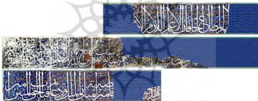
تصویر ۷. کتیبه جهانشاه در زیر ایوان ورودی به خط محقق

ب و ج) در دیوار محل محراب گنبدخانه دو کتیبه به خط بنایی متداخل دیده می‌شود؛ در ضلع غربی کلمه «الله» و در داخل آن سوره توحید نگاشته شده است و در ضلع شرقی کلمه «مُحَمَّد» و در داخل آن سوره کوثر نوشته شده است به عبارتی دیگر هر کلمه با مفهوم مرتبط با آن کتیبه پر شده است (تصویر ۸). «سوره‌ی توحید خدای تعالی را به احدیت ذات و بازگشت ما سوی الله در تمامی حوائج وجودیش به سوی او و نیز به اینکه احدی نه در ذات و نه در صفات و نه در افعال شریک او نیست می‌ستاید» (طباطبایی، ۱۳۸۶: ج ۹، ۶۶۹). سوره‌ی کوثر نیز در شأن حضرت فاطمه (س) نازل شده و