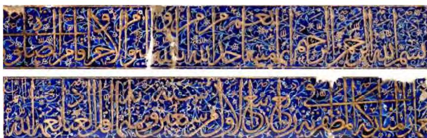
تصویر ۶. ابتدا و انتهای کتیبه سردر، آیات ۱۸ و ۱۹ سوره توبه و تاریخ و رقم خوشنویس به خط ثلث

در بازار حقیقت هیچ وزن و ارزشی ندارد، پس مؤمنین نباید صرف ظاهر اعمال را معتبر شمرده و آن را ملاک فضیلت و قرب خدای تعالی بدانند، بلکه باید آن را بعد از در نظر داشتن حیات که همان ایمان و خلوص است به حساب بیاورند» (طباطبایی، ۱۳۸۶: ج ۹، ۷۲-۲۶۸).