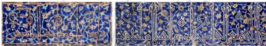
تصویر ۳. کتیبه‌های کوفی،

آیات قرآن در کتیبه‌های معماری اسلامی، با توجه به محل کتیبه و بسته به فضای آن انتخاب و ارائه شده و حاوی مطالب و رموز گوناگونی هستند. بزرگترین کتیبه مسجد کبود که تمام آن غیر از کلمات اول و آخر آن از بین رفته از ضلع شرقی سردر شروع و به ضلع غربی آن خاتمه می‌یافت و تنها کلمات «قَالَ اللَّهُ تَعَالَى» از ابتدا و «...الْعَظِيمِ» از انتهای آن باقی مانده است. همین دو کلمه می‌تواند نشانگر یک متن قرآنی باشد اما متأسفانه تمام آن از بین رفته و در مکتوبات تاریخی نیز بدان اشاره نشده است. با توجه به باقی کتیبه‌ها تنوع موضوعی آیات را در کتیبه‌های مسجد کبود به شکل ذیل می‌توان طبقه بندی کرد: