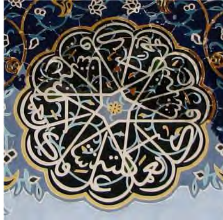
تصویر ۴. آیه ۸۴ سوره اسراء در قالب شمسه