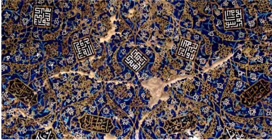
تصویر ۱۰. نام پیامبران اولوالعزم و حضرت علی علیه السلام در زیر ایوان ورودی

استفاده از سوره کوثر بصورت کتیبه بنایی متداخل با کلمه محمد را می‌توان در راستای اعتقاد قراقویونلوها بر تشیع تفسیر کرد. به ویژه اینکه کتیبه حاوی نام ائمه اطهار (ع) در سردر (نعمتی و مطمئن، ۱۳۹۸: ۷-۱۰۵) و نیز کتابت نام امام علی (ع) به همراه نام پیامبران اولوالعزم در زیر طاق سردر و استفاده مکرر از نام حسنین در مسجد این تفسیر را تقویت می‌کند. نام انبیاء اولوالعزم تنها یکبار و در زیر ایوان ورودی مسجد به همراه نام حضرت علی (ع) در کادری مربع با خط بنایی به رنگ سفید در زمینه مشکی آمده و به ترتیب چنین هستند: «مُحَمَّدٌ رَسُولُ اللَّهِ، عَلِيُّ وَوَلِيُّ اللَّهِ، عِيسَى رُوحُ اللَّهِ، مُوسَى كَلِيمُ اللَّهِ، إِبْرَاهِيمَ خَلِيلِ اللَّهِ» (تصویر ۱۰). کتیبه ابتدا و انتها از بین رفته است که احتمالاً «لَا إِلَهَ إِلَّا اللَّهُ» و «نُوحٌ نَبِيُّ اللَّهِ» و یا «آدَمُ صَفْوَةُ اللَّهِ» بوده است. نگارش نام امام علی (ع) پس از نام حضرت محمد (ص) و پیش از نام پیامبران اولوالعزم می‌تواند تفسیری از اندیشه حروفیان از مقام امام علی (ع) باشد. آنان امام علی (ع) را آغازگر دوره ولایت دانسته و مقام او را غیر از وحی برابر با حضرت محمد (ص) می‌دانستند. از سویی نشانی از رواج اندیشه رایج در بحث دایره نبوت و امامت که توسط عرفای متشیع همچون سید حیدر آملی در قرن هشت و نه مطرح شده است بوده (شایگان، ۱۳۸۷: ۱۲۳-۱۱۷) و بازتابی از اعتقاد شیعیان به مقام ولایت و امتداد نبوت در امر امامت است.