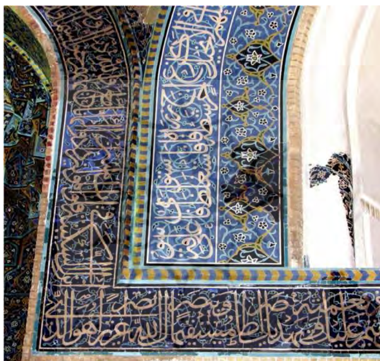
تصویر ۹. بخشی از کتیبه سوره فتح

آن در طاق جنوب غربی و طاق جنوب شرقی نوشته شده است (تصویر ۹). سوره فتح پس از ماجرای صلح حدیبیه بر پیامبر (ص) نازل شد. (مکارم شیرازی، ۱۳۶۹: ج ۲۲، ۳) در این سوره خدای تعالی رسول گرامی خود را وعده فتح و یاری می‌دهد و خبر می‌دهد که به‌زودی آن جناب مشاهده می‌کند که مردم گروه گروه داخل اسلام می‌شوند و دستورش می‌دهد که به شکرانه این یاری و فتح خدایی، خدا را تسبیح کند و حمد گوید و استغفار نماید (طباطبایی، ۱۳۸۶: ج ۲۰، ۶۵۱).