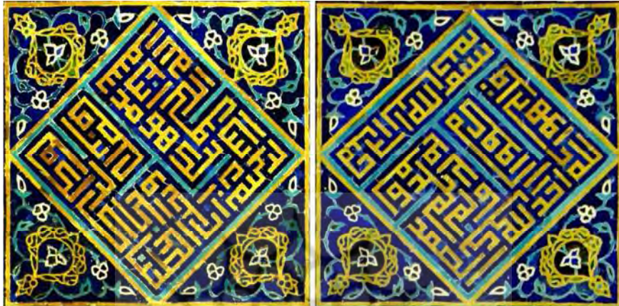
تصویر ۸ دو کتیبه بنایی متداخل در محل محراب گنبدخانه، راست: «الله» و سوره توحید؛ چپ: «محمد» و سوره کوثر

در آن خداوند متی بر رسول خدا (ص) نهاده به اینکه به آن جناب کوثر داده، و این بدان منظور است که آن جناب را دلخوش سازد و بفهماند که آن کس که به وی زخم‌زبان می‌زند که اولاد ذکور ندارد و اجاق کور است، خودش اجاق کور است و این سوره کوتاه‌ترین سوره قرآن است (طباطبایی، ۱۳۸۶: ج ۹، ۶۳۷).