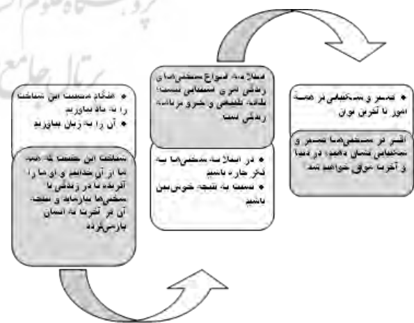
نمودار ۱: تأثیر شناخت در صبر

انواع شناخت‌های مرتبط با ماهیت دنیا در نقشه کلی زندگی از دیدگاه قرآن کریم و دیگر شناخت‌های وابسته به آن و نیز شناخت‌های متصل به رفتار، باعث به‌وجود آمدن زمینه صبر پایدار تا آخرین لحظه زندگی می‌شوند. نحوه تأثیر‌گذاری شناخت استرجاع، به‌عنوان نقشه الهی زندگی، در صبر و شکیبایی، آن‌گونه که از آیات استفاده می‌شود، در نمودار (۱) نشان داده شده است.