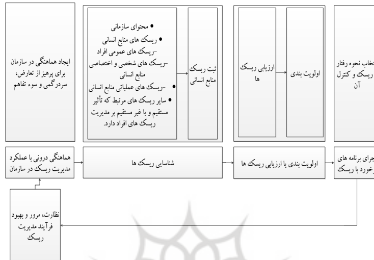
شکل ۱. مدل مدیریت ریسک منابع انسانی [۲۴]

در شکل ۱ مدلی برای مدیریت ریسک منابع انسانی نشان داده شده است: