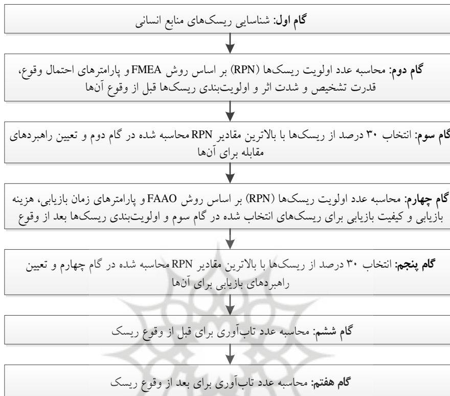
شکل ۲. گام‌های فرایند پژوهش