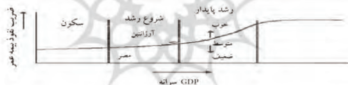
شکل ۲- ضریب نفوذ بیمه عمر

در مرحله بلوغ بازار بیمه، رشد آهسته مجدداً بر بازار بیمه حکفرما می شود و ممکن است حتی با یک وقفه نسبت به رشد اقتصادی اتفاق بیفتد. بازار بیمه به کشف ریسکهای جدید و ارائه راه حل های جدید برای پوشش آنها می پردازد، اما منافع آن نسبت به مرحله قبل رشد و توسعه بازار بیمه کمتر است. همانطور که ملاحظه شد قدرت پیوند بین بخش بیمه و رشد اقتصادی ایستا نیست در حالی که ارتباط بین بانک، بازار سرمایه و رشد اقتصادی با سطح توسعه اقتصادی تغییر می کند، رابطه بین بیمه و رشد اقتصادی نیز تغییر می کند. بخش بیمه در کشورهای توسعه یافته مجموعه کاملی از محصولات و خدمات تخصصی شده و کلان آموزش دیده و باتجربه را ارائه می دهد و پوشش بیمه به عنوان یک ارزش مهم شناسایی می شود. به نظر می رسد که درآمد یا تولید ناخالص داخلی یک سرمایه معنادارترین تأثیر را با پیروی از نرخ بهره و تورم بر مصرف بیمه دارد. اهمیت قیمت بیمه برای تقاضای بیمه مبهم است، اما مطالعات بسیاری بیمه را یک کالای لوکس (با اشاره به کشش درآمدی بیشتر از واحد) یافته اند. (USAID, 2006)