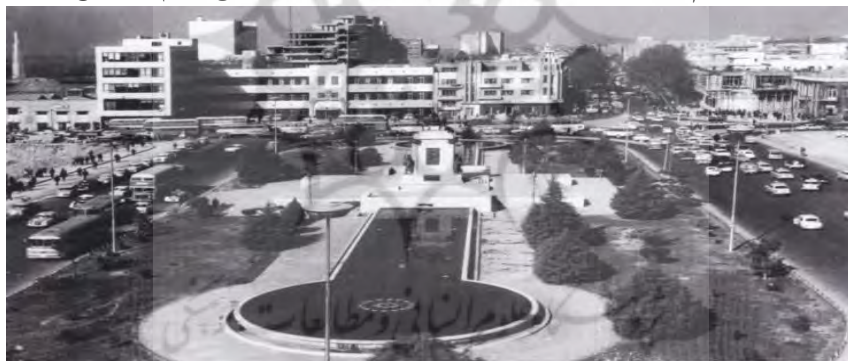
شکل ۳: میدان امام خمینی (توپخانه)، در زمان پهلوی دوم (۱۳۴۱)