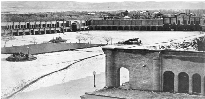
شکل شماره ۱: میدان امام خمینی (توپخانه)، در زمان قاجار