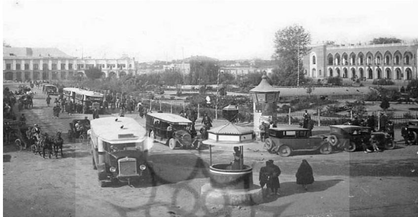
شکل ۲: میدان امام خمینی (توپخانه)، در زمان پهلوی اول (۱۳۱۰)