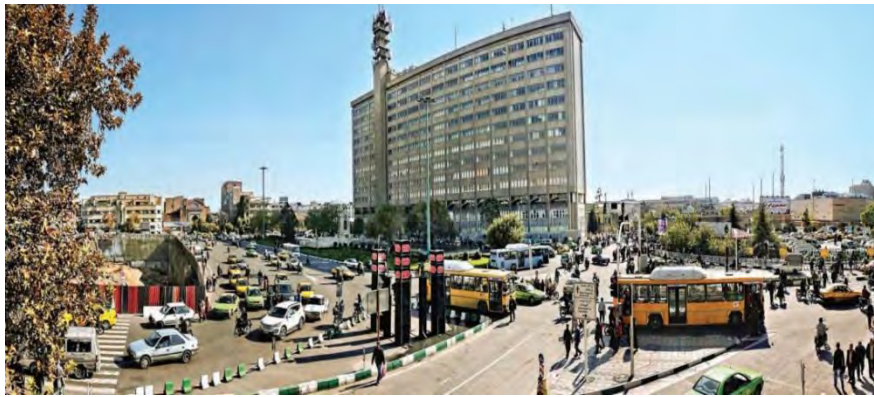
شکل ۴: میدان امام خمینی (توپخانه)، منبع (فکوهی، سیارپور، سال ۱۳۹۳، ۴۵)