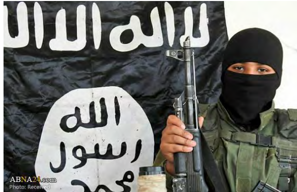
تصویر شماره ۵: ابو عمر العراقي، عامل حمله به سامرا عراق - تیر ۱۳۹۶

از تصاویر بررسی شده، پس‌زمینه تصویر عامل انتحاری در ۴۸ درصد (۲۴ مورد) شامل ادوات نظامی اعم از تانک و خودرو بمب‌گذاری شده، در ۲۸ درصد (۱۴ مورد) نیز پرچم سیاه‌رنگ داعش و در ۲۴ درصد (۱۲ مورد) غیر از آن است. فراوانی موقعیت‌های طبیعت نیز در تصاویر داعش قابل توجه است. نشانه‌ی پرچم سیاه‌رنگ داعش کاملاً در تصویر شماره ۵ نمایان است.