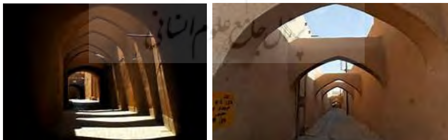
تصویر ۳- نمایش سایب‌ها و کوچه‌های سرپوشیده شهر یزد در عهد قاجار