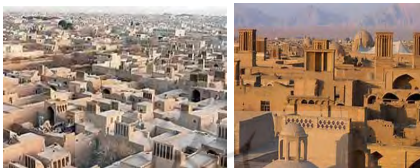
تصویر ۱- نمایش بخشی از بافت تاریخی شهر یزد متعلق به عهد قاجار (نمای از دید پرنده)

بدنه معابر و جهت حرکت خورشید و محاسبات تنظیم شرایط محیطی، آسان و خوشایند بوده است. از طرفی با تشکیل سایه‌روشن‌های زیبا با این عناصر، سیما و منظر شهری و پرسپکتیوهای زیبایی برای رهگذر خلق شده است (تصویر ۳). مناظر و سیمای شهری از دیگر مؤلفه‌های هویت کالبدی یزد بوده و مورد اشاره جکسون است.