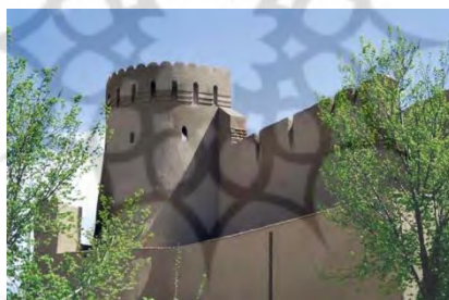
تصویر ۲- نمایش برج و باروی قدیمی یزد