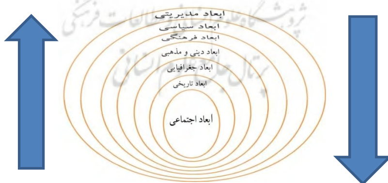
نمودار شماره ۱: ماتریکس روابط مقولات اصلی و هسته‌ای

با استناد به مصاحبه‌های انجام شده در این تحقیق و تفسیر معنایی آنها به تناظر ابعاد اجتماعی، تاریخی، جغرافیایی، سیاسی، فرهنگی، دینی و مذهبی و مدیریتی می‌توان به مدل ماتریکسی متحدالمرکز از روابط این ابعاد با هویت ملی ورزشی (نمودار شماره ۱) دست یافت. هم‌چنین رابطه‌ی معنایی و محتوایی زیر طبقات این ابعاد، بنا به همسویی و رابطه کنشی میان ریزمقولات آنها مؤید ساختاری شبکه‌ای میان مفهوم هویت ملی و هویت ورزشی است که می‌تواند بر سازنده‌ی نظام معانی حول محور این مفهوم باشند (نمودار شماره ۲). در واقع این دو مدل و توازی تفسیر معنایی مقولات در ابعاد مختلف هویتی مصاحبه‌ها نشان می‌دهد، افراد بسی بیشتر از تعاریف و ساخت‌های هویت‌ورزی دولت‌ها، در پی بازنمایی و برساخت هویتی خویش از طریق حضور در میداين ورزشی هستند. در بازسازی سیر داستانی پاسخ مشارکت‌کنندگان مختلف، براساس نحوه‌ی کدبندی و مقوله‌سازی در این تحقیق، می‌توان نتیجه گرفت که در کنار عوامل بازدارنده‌ای از قبیل تبعیض، دو قطبی‌سازی و مصرف‌گرایی ضمنی ورزش، که به‌عنوان کارکردهای منفی مدیریتی موجب تحقق هویت‌های مقاومتی شده‌اند، روحیه‌ی چرخش مراقبتی فرصتی برای احیای هویت ملی است که خود محصول برهم کنش میان زیر طبقات ابعاد هفتگانه است. این فرصت ارتباطی که در نمودار ۲ نشان داده شده است، می‌تواند به شکل چرخشی خدماتی الگویی برای سیاست‌ورزی دولت‌ها و نهادهای مدیریتی در سمت و سوی ایجاد تعادل مذکور میان هویت فردی و هویت ملی باشد.