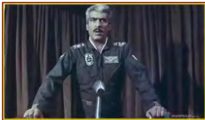
تصویر شماره ۳