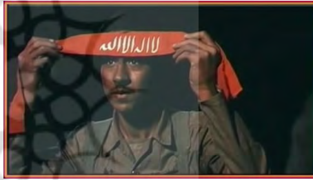
تصویر شماره ۲

انتخاب بازیگران: انتخاب بازیگران از چند حیث حائز اهمیت است اول از همه ظاهر و میمیک چهره بازیگران بخودی خود در انطباق با شخصیت فیلم اثرگذار است. دوم این‌که هنرمندان معروف و مشهور (ستاره) می‌توانند در کسب همدلی بیننده تأثیرگذار باشند و سوم با توجه به ویژگی بینامتنی، برخی از هنرمندان در ایفای نقش مثبت و برخی دیگر در ایفای نقش منفی اثرگذارتر هستند.