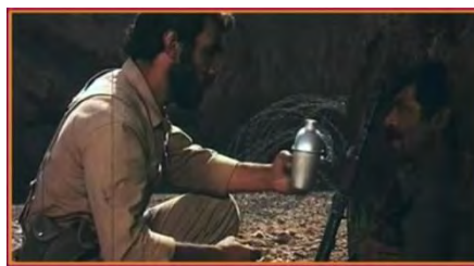
تصویر شماره ۶

صدا (دیالوگ و موسیقی): صدا از رمزگان فنی فیلم است که خود شامل دو بخش دیالوگ شخصیت‌های فیلم و آهنگ پس‌زمینه است.