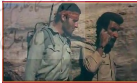
تصویر شماره ۸

دوربین: دو دسته از امکانات فنی دوربین «نماها و زاویه» در انتقال و القاء معانی مورد نظر کارگردان تأثیر به‌سزایی دارند که به تحلیل آن بر فیلم پرواز در شب و عقاب‌های پردازیم.