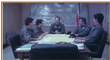
تصویر شماره ۵