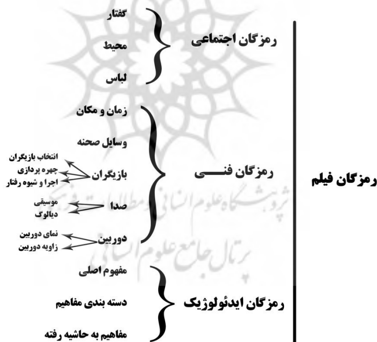
شکل ۱: عناصر تحلیل رمزگان جان فیسک

با استفاده از روش تحلیل رمزگان جان فیسک و ایجاد تغییراتی در این روش، برای تحلیل دو فیلم عقاب‌ها و پرواز در شب که با روش نمونه‌گیری هدفمند انتخاب شده است، از عناصری که در شکل شماره ۱ آمده، استفاده شده است.