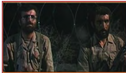
تصویر شماره ۴