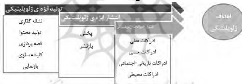
مدل شماره (۱)، سطوح کارکردی در ژئوپلیتیک عمومی

می‌توان این‌گونه گفت، که هدف غایی و در نتیجه کارکرد ژئوپلیتیک عمومی کسب، حفظ و افزایش قدرت است. اما در این میان مراتب بسیار مهم دیگری از تولید ابژه