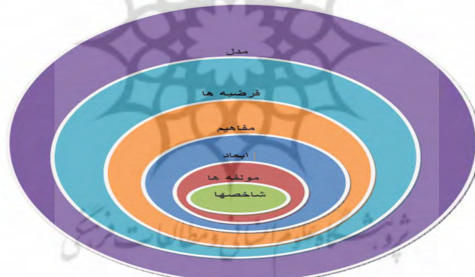
شکل شماره ۱: پایه‌های نظری مدل، (اقتباس از نظریه کیوی و کامپنهود)

با این شرح، برای شناسایی جریان‌های فرهنگی در ایران ابتدا نیازمندیم ساختار و مدلی را مشخص نموده و سپس طبق آن ساختار و مدل، همه جریان‌های موجود را دسته‌بندی و آنگاه تبیین و تشریح کنیم. برای ساختن مدل دو روش فرضی - استقرایی و روش فرضی قیاسی وجود دارد که محقق از روش دوم بهره گرفته است در این روش، مدل «بر مبنای یک اصل موضوع یا یک مفهوم کلی که به‌عنوان پیش‌فرض تفسیر پدیده موضوع تحقیق انتخاب شده است، آغاز می‌شود. این مدل با استدلال منطقی، فرضیه‌ها، مفاهیم و شاخص‌ها را می‌سازد که داده‌های مشاهده باید آنها را تأیید کند» (کیوی و کامپنهود، ۱۳۸۶: ۱۵۰).