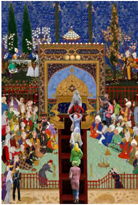
تصویر شماره ۲: سودی شریفی: هفته مد