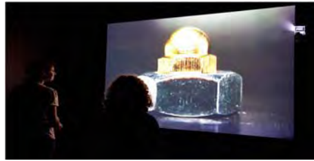
تصویر شماره ۱: قادر عطیه: تاریخ یک اسطوره: قبه الصخره کوچک