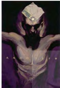
تصویر شماره ۴: اثری از آیدین آغداشلو