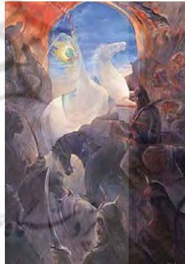
تصویر شماره ۵: حبیب‌الله صادقی