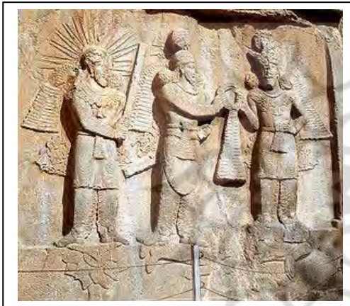
تصویر شماره ۵: نقش برجسته اهدای حلقه فرّه ایزدی به اردشیر دوم توسط اهورامزدا که در سمت چپ میثرا بر روی گل نیلوفر ایستاده است. طاق بستان، کرمانشاه، ایران

شاید نتوان در ایران گل لوتوس را نمادی از آتش دانست؛ اما باید به این نکته توجه داشت که در هند گل نیلوفر به‌عنوان بارزترین نماد آتش شناخته می‌شود و از آنجا که در دوران هخامنشیان آتش از جایگاه والا و مقدسی برخوردار بوده شاید بتوان نقش گل نیلوفر در حجاری‌های تخت جمشید را به‌عنوان مثالی نمادین از آتش دانست که تحت تأثیر تمدن هند و به علت اشتراک مفهومی در هر دو فرهنگ وارد ایران شده است.