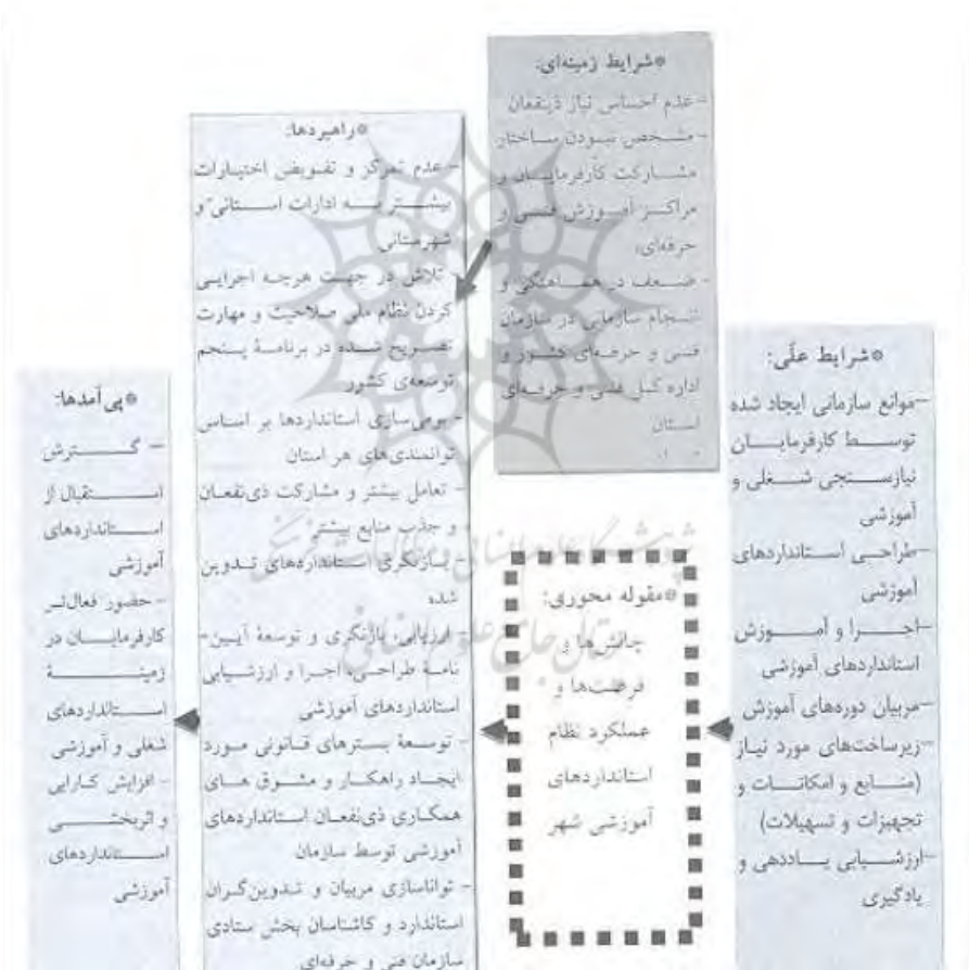
نمودار (۱). الگوی پارادایمی چالش‌ها و فرصت‌ها و عملکرد نظام استانداردهای آموزشی استان کردستان بر اساس نظریه داده بنیاد

▪ توزیع پرسشنامه‌ها میان فراگیران، مربیان، تدوین‌گران استاندارد و مدیران و کارشناسان اداره کل فنی و حرفه‌ای شهر سنندج. بنابراین، در ادامه بحث به تبیین الگوی پارادایمی بازسازی و بهسازی نظام استاندارد آموزشی در استان کردستان و شهر سنندج بر اساس روش داده‌بنیاد می‌پردازیم. همان‌گونه که بیشتر هم ذکر شد، در الگوی پارادایمی (که توسط اشتروس و کوربین (۱۹۹۰) ارائه شد) برای تبیین بهتر نظریه مطرح‌شده باید عناصر پنجگانه (پدیده مورد مطالعه، شرایط علمی، زمینه تأثیرگذاری، عامل‌های مداخله‌گر، راهبردهای مورد نظر و پیامدها) مورد توجه قرار گیرد در حقیقت بحث و نتیجه‌گیری ناظر بر تشریح الگوی پیشنهادی است.