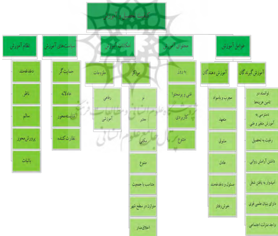
شکل (۱) مؤلفه‌های برساننده کیفیت تحصیل و آموزش

همان‌گونه که در نمودار زیر مشاهده می‌شود، شهروندان مشارکت‌کننده در این پژوهش، کیفیت تحصیل و آموزش را در پنج مولفه «عوامل آموزش»، «محتوای آموزش»، «امکانات آموزش»، «سیاست‌های آموزش» و «نظام آموزش» قرار می‌دهند. در ادامه این مؤلفه‌ها و دغدغه‌های برساننده آن‌ها به تفکیک توضیح داده شده است.