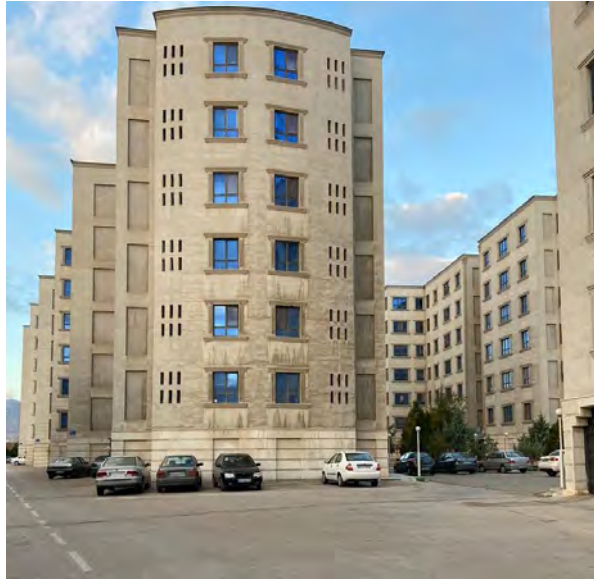
تصویر ۲. نمایی از مجتمع مسکونی رضوان