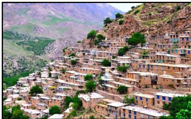
شکل ۵. سیمایی از توده خانه‌های روستایی اورامان