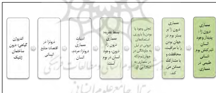
شکل ۱. گام‌های استدلال منطقی مفهوم درونزایی در معماری به معنی پدیدار وجود انسان اندرکنش بوم که در معماری به محضر می‌آید

معنایی پیش فرض شده‌ای است، انسان در جهان را دازاین (Dasean) در نسبت با وجود خواند و به معنای آنجا بودن می‌داند و تجلی وجود انسان در جا و جهان ظهور می‌کند و برای بودن و باشیدن وجود جا و انسان را لازم و ملزوم یکدیگر می‌داند و رابطه وجود و جهان یک رابطه دو طرفه است و وجود یا existence به معنی خارج ایستادن است و یعنی انسان تنها موجودی است که از بودن خود در جا و جهان آگاهی دارد (صافیان و دیگران، ۱۳۹۰: ۱۰۴). تحلیل وجود انسان و تجلی آن در جایی، معنی دازاین است و آنجا در جهان و با خود و دیگران سرشار از معنا توصیف می‌شود (همان، ۱۲۴). وجود به معنی بودن در جا، و در جهان به معنی مکان است که مکان اساس فلسفه وجود او را نیز تشکیل می‌دهد؛ مکان و وجود آنچنان در هم پیچیده اند که یک سو مکان در وجود و از سوی دیگر وجود در مکان ظهور و تجلی می‌یابد (Malpas, 2008, 11). از این رو دازاین برای بودن و باشیدن به معنی تجلی وجود در جهان و با دوستی و انس گرفتن با زیست جهان در جهت حفاظت و مراقبت از خود، دیگری، آسمان و آسمانیان و جهان معنی می‌یابد. سکنی گزیدن با حفاظت و مراقبت از آسمان، زمین، زمینیان و آسمانیان (خدایگان) تفسیر می‌شود (Heidegger, 1997). بنابراین در مفهوم معماری درونزا وجود انسان بدون محمل و بستر تجلی، ممکن نمی‌گردد که همانا محمل تجلی در جهان یا همان بوم انسانی طبیعی است که در معماری به تماشا می‌آید، که برای تداوم، بقاء و جاودانگی این اندرکنش انسان در جهان و بوم به معنی بودن مستلزم محافظت و مراقبت از آن جهان یا بوم است. بطور خلاصه این استدلال در شکل (۱) آمده است.