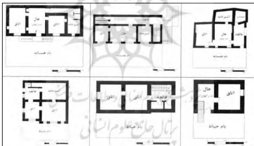
شکل ۴. الگوی پلان خانه‌های روستاهای اورامان. منبع: (سالم محمد و دیگران، ۱۳۹۸: ۴۲).

به ابعاد وجودی و ماهیتی حفظ و بازسازی بافتها و الگوهای واحدهای مسکونی با نگاه هویتی برآمده از بوم انسانی طبیعی نبوده و موجبات از میان رفتن الگوهای فرهنگی ارزشمند و باعث لطمات فرهنگی، زیست محیطی و ناپایداری بوم شده است. بنابراین پژوهش اخیر می‌تواند دید راهبردی و ماهیتی به دست اندرکاران بدهد. اورامان یا هورامان به مناطقی از غرب ایران تا مناطقی از کشور عراق در کوهستانهای زاگرس شمالی در استانهای کرمانشاه، کردستان و شمال شرقی عراق اطلاق می‌شود که معماری بومی سکونت گاه‌های روستایی آن به شکل توده وار، به هم پیوسته و درهم تنیده با فرم پلکانی در دامنه کوه مشرف به رودخانه و باغات پایدار شده است شکل (۴)، (۵) و نقشه (۱). معماری بومی حکایت از فرهنگ توده‌ی مردم و مرتبط با زندگی روزمره و آرمان‌های انسانی و شیوه مواجهه با طبیعت بوده است، سازندگان بناهای بومی فقط مصرف کننده نبوده اند بلکه در همبستگی با سنت و فرهنگ توده‌ی مردم بخش عظیمی از محیط را شکل داده اند (Rapoport, 1969). مسکن بومی با وضوح بیشتری پیوند و ارتباط میان شکل مصنوع و شیوه‌ی زندگی و فرهنگ را نشان می‌دهد (Ibid). شاید در اولین برخورد با معماری کوهستان، چیزی که به ذهن میرسد، ساخت فضای حداقل برای یک زندگی ساده باشد؛ اما در کنکاشهای عمیق، وجود یک هوش جمعی کارآمد و زیبا، در پس کالبد معماری، مشهود است؛ آنچنان که هر امری از چندین زاویه بررسی شده و مناسبترین گزینه اجرا میشود (معماریان و همکاران، ۱۳۹۳: ۵۶).