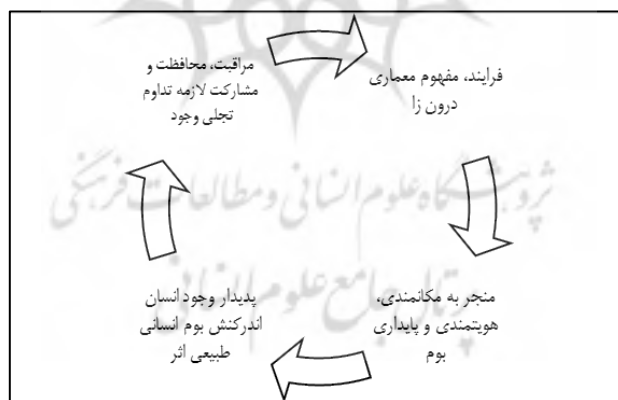
شکل ۳. بودن در جهان با پدیدار وجود انسان اندرکنش بوم انسانی طبیعی در معماری

وجود با در جهان (بوم) بودن ممکن است. در جهان (بوم)، بودن در معماری معتبر میسر است و آن معماری حاصل بودن وجود در جهان است یعنی بودن وجود در جهان با جا، بوم و معماری لازم و ملزومند. معماری معتبر چیزی را که طبیعت و محیط کم دارد اضافه می‌کند چنانچه واحه‌ای در بیابان خلق می‌شود (شولتز، ۱۳۹۳: ۱۱۲). معماری معتبر حاصل رویدادگی و به محضر آمدن جهانی از وجود انسان اندرکنش بوم انسانی طبیعی است، و فهم در جهان بودن و باشیدن در معماری با محافظت و مراقبت از جهان میسر می‌شود. معماری درونزا با محوریت وجود انسان در جا و مکان، فرایند، مفهومی است که جهانی از وجود انسان اندرکنش بوم را به محضر می‌آورد و بودن وجود در جهان را ممکن می‌کند. یعنی معماری درونزا فرایند، مفهومی پدیدارشناسانه است که جهانی از بوم انسانی طبیعی بستر اثر را در معماری به تماشا یا محضر می‌آورد و به فهم بقاء وجود در بوم بر می‌گردد تا تداوم تجلی وجود همواره مهیا شود شکل (۲) و (۳). بنابراین: الف. معماری درونزا معطوف به انسان و اصالت وجود انسان است. ب. وجود انسان در جا و جهان یا بوم انسانی طبیعی چنان لازم و ملزوم یکدیگرند. پ. جهان (بوم) چنان محملی برای امکان تجلی و تداوم بودن وجود است. ت. وجود در جهان و بوم با محافظت، مراقبت و مشارکت ممکن است. ث. معماری درونزا فرایند مفهومی است پدیدارشناسانه که جهانی از وجود انسان اندرکنش بوم انسانی طبیعی بستر اثر را در معماری به محضر می‌آورد و توأم با محافظت، مراقبت و البته با مشارکت میسر است. ج. حصول به وجوه معماری درونزا با پدیدارشناسی وجود انسان اندرکنش بوم انسانی طبیعی بستر برای جاودانگی فراهم می‌شود که در معماری به محضر می‌آید.