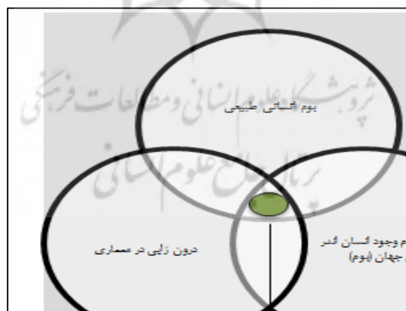
شکل ۲. مدلی برای مفهوم درونزایی در معماری که به معنی وجود انسان در کنش با بوم است که در معماری به حضور می‌رسد.