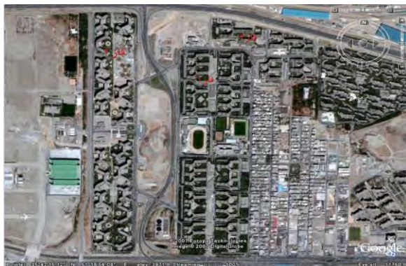
شکل ۲. نقشه هوایی شهرک اکباتان با معرفی فاز های ۱ و ۲ و ۳ این شهرک، ( https://disamag.com )

شهرک اکباتان (شکل ۱) به عنوان یکی از بزرگ‌ترین شهرک‌های خاورمیانه در شمال جاده مخصوص کرج و در ۵ کیلومتر ۵ میدان آزادی تهران واقع بوده و بر اساس نظام تقسیمات کالبدی شهرداری تهران بخشی از ناحیه ۶ منطقه ۵ محسوب می‌شود. ناحیه ای به نسبت گسسته از ساختار کل منطقه که تنها، موقعیت جغرافیایی آن سبب تجمع آن با سایر نواحی منطقه شده است. ناحیه یاد شده نه به لحاظ عملکردی و نه به لحاظ سیمایی هیچ‌گونه تشابهی با نواحی دیگر نداشته و به واسطه دربرگرفتن چهار مجتمع سکونت‌ی کوی بیمه و شهرک‌های اکباتان، شهید فکوری و آپادانا دارای عملکرد غالب سکونتگاهی و خوابگاهی است (مهندسان مشاور شارمند، ۱۳۸۲). در این میان شهرک اکباتان به عنوان یکی از نخستین تجربیات نظام شهرسازی ایران در زمینه بلند مرتبه سازی و به واسطه موقعیت مکانی آن که در یکی از مبادی ورودی پایتخت واقع شده، نه تنها در سطح منطقه بلکه در سطح شهر نیز واجد جایگاه و اهمیت خاصی است. این شهرک که از شمال به کوی فردوس، از جنوب به فرودگاه مهرآباد، از غرب به صنایع هواپیماسازی و از شرق به شهرک آپادانا محدود می‌شود، از ۳ فاز و ۳۳ بلوک تشکیل شده است و جمعیتی در حدود ۷۰۰۰۰ نفر دارد که در ۱۵۵۹۳ واحد مسکونی سکونت دارند (شکل ۲) (رفیعیان و همکاران، ۱۳۸۹).