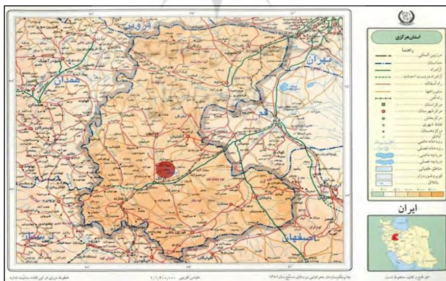
تصویر ۱. موقعیت روستای میقان در نقشه استان مرکزی

شهرستان اراک در فلاتی که در اطراف آن را کوهستان احاطه کرده، قرار دارد. روستای میقان در دهستان مشهد میقان در شهرستان اراک در استان مرکزی واقع شده است. روستای میقان در ۱۱ کیلومتری شمال اراک در نزدیکی کویر میقان از توابع بخش مرکزی شهرستان اراک است که در مختصات ۴۹ درجه و ۳۲ درجه طول شرقی و ۳۴ درجه و ۱۳ دقیقه عرض شمالی واقع شده است. ارتفاع متوسط این روستا از سطح دریا ۱۶۳۰ متر است (طرح هادی روستای میقان).