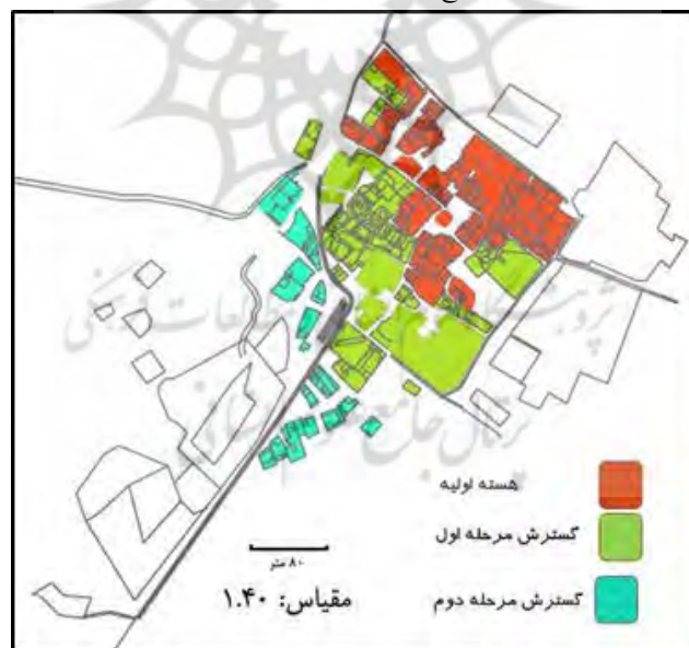
تصویر ۲. تحلیل سیر تطور روستای میقان منبع: (طرح هادی روستای میقان)

آب و هوای این منطقه دارای شرایط مدیترانه‌ای است و از ویژگی‌های آن فصل خشک و طولانی تابستان و دوره بارندگی در فصول سرد است. بر اساس بررسی‌های انجام‌شده و با توجه به ایستگاه اراک جهت باد غالب از سمت غرب به شرق است. باد غالب در نیمسال اول از شرق به غرب می‌وزد و منازل مردم را خنک می‌کند و در نیمسال