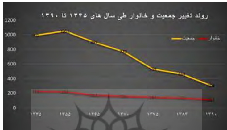
تصویر ۳. روند تغییر جمعیت و خانوار روستا از ۱۳۴۵ تا ۱۳۹۰

روستای میقان از قدمتی بالغ بر ۲۸۰۰ سال برخوردار است که متأسفانه طی ۴۰ سال اخیر مورد بی‌توجهی مردم و مسئولین قرار گرفته است و این امر موجب ترک روستا توسط اهالی و مخروبه شدن آن شده است. طبق اطلاعات به‌دست‌آمده قدمت تاریخی روستای میقان به حدود سال‌های ۸۱۰ ق.م؛ یعنی دوره مادها و زمانی که به فلات ایران می‌آیند بازمی‌گردد (طرح هادی روستای میقان). جمعیت روستا طی سال‌های ۱۳۴۵ تا ۱۳۶۵ با رشد جمعیت و طی سال‌های ۱۳۶۵ تا سال ۱۳۹۰ با کاهش جمعیت مواجه بوده است. در سال ۱۳۹۰ طبق سرشماری جمعیت برابر با ۳۰۴ نفر بوده است و در سال ۱۳۹۵ طبق آخرین سرشماری، ۱۹۵ نفر جمعیت دارد که این نشان‌دهنده‌ی خالی شدن روستا از سکنه است (سازمان آمار).