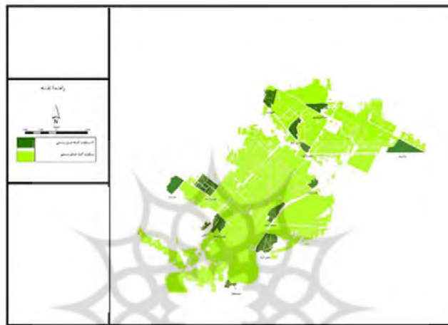
شکل ۲. سکونتگاه‌های غیررسمی کرمانشاه در سال ۹۵

بوده موجبات مهاجرت و ورود به شغل‌های کاذب را فراهم کرد که بدین گونه حاشیه‌نشینی در کرمانشاه نیز شکل گرفت و این در حالی است که اگر مسئولان ساماندهی مشاغل روستایی به رفع تنگناها و چالش‌های روستا و روستانشینان می‌پرداختند این اتفاق نمی‌افتاد. ۳- یکی دیگر از عوامل حاشیه‌نشینی وسعت و گسترش بی‌رویه شهر کرمانشاه است به ویژه در تعریف موقعیت شهری وارد کردن روستاهای مجاور شهر به عنوان بخشی از شهر کرمانشاه که ظاهراً و از نظر جغرافیایی این تغییرات فقط از نظر اسمی اتفاق افتاد ولی در موقعیت پیشین آنها تغییر حاصل نشد که به این ترتیب این وسعت شهری از نظر جغرافیایی علاوه بر آنکه شهریت و شهرنشینی را وسعت نداد، موجب گسترش حاشیه‌نشینی با نام و نشان شهرنشینی شد (همان منبع).