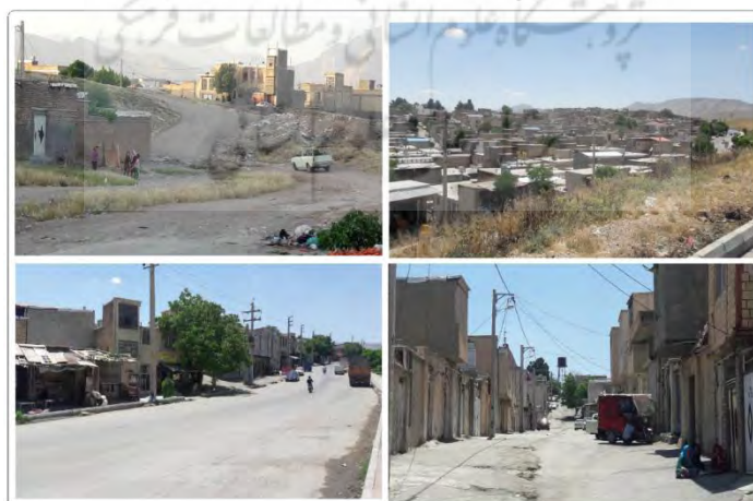
شکل ۴. نمایی از سکونتگاه‌های غیررسمی جعفرآباد