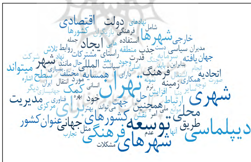
شکل ۲. ابر واژگان مرتبط با دیپلماسی شهری و جهانی‌سازی

در این قسمت، با توجه به ابعاد شباهت و اختلاف کدهای شناسایی شده، کدهای دارای مشابهت در یک گروه قرار گرفت و در نهایت برای هر گروه کد شناسایی شده نامی مشخص انتخاب گردید. بدین طریق، شش کد اصلی و در نهایت ۸۵ مقوله شناسایی گردید. شرح این عوامل و موارد به قرار شکل زیر ارائه گردیده است. در ادامه ماتریس مربوط به فراوانی کدهای شناسایی شده در ارتباط با هر کدام از مصاحبه‌های انجام گرفته ارائه شده است. در ادامه فراوانی واژگان به کار رفته توسط مصاحبه‌شوندگان، به عنوان یکی از خروجی‌های نرم‌افزار MaxQDA ۲۰۲۰ ارائه شده است. ارائه رویکردی تفسیری از نتایج مصاحبه‌های صورت گرفته از مزیت‌های استفاده از این خروجی است. صدرنشینی سه واژه تهران، توسعه و دیپلماسی (به همراه شهر) نشان می‌دهد که از نظر کارشناسان مورد پرسش قرار گرفته، در مجموع معتقد هستند که دیپلماسی شهری می‌تواند باعث توسعه شهر تهران گردد. در ادامه واژگانی نظیر فرهنگ و محلی، در حقیقت بهره‌گیری از ظرفیتهای محلی-فرهنگی در مقصدهای مورد نظر دیپلماسی شهری را عوامل بسیار مهم و با اهمیتی ارزیابی می‌شود. در ادامه، مدیریت، اقتصاد و جهانی، ترکیب‌هایی هستند که هم‌نشینی آنان با یکدیگر می‌تواند به معنای بهره‌گیری (مدیریت) فرصتهای اقتصادی جهانی جهت توسعه شهری را نشان دهد. سایر واژگان شناسایی شده نیز بسته به رتبه و میزان تکرار خود مقادیر متفاوتی از اهمیت را در ارتباط با دیپلماسی شهری و جهانی‌سازی کسب نموده‌اند. ابر واژگان حاصل از مصاحبه‌های صورت گرفته به شکل زیر ارائه شده است. بزرگی هر واژه نشان دهنده تعداد تکرار واژگان یاد شده است.