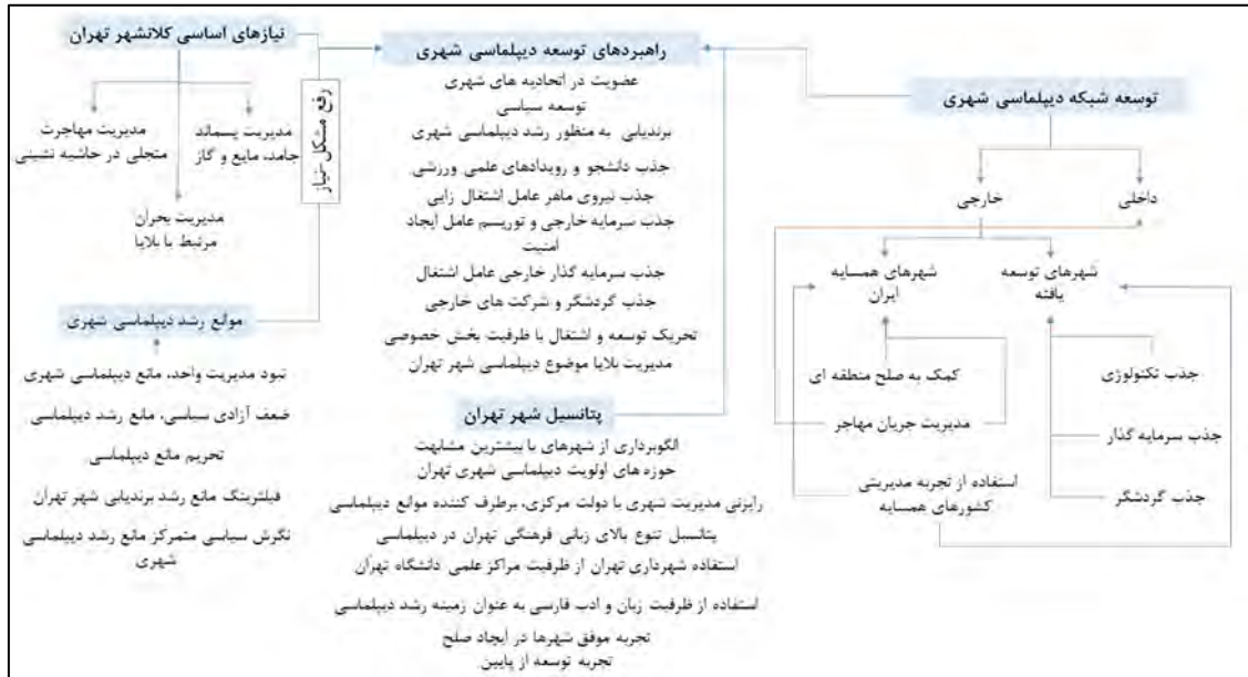
شکل ۴. مدل پژوهش