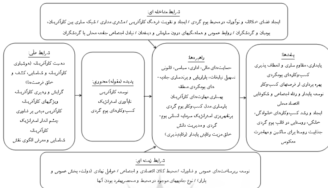
شکل ۲- مدل مفهومی توسعه کارآفرینی با رویکرد تاب‌آوری استراتژیک در کسب و کارهای نوپای گردشگری.