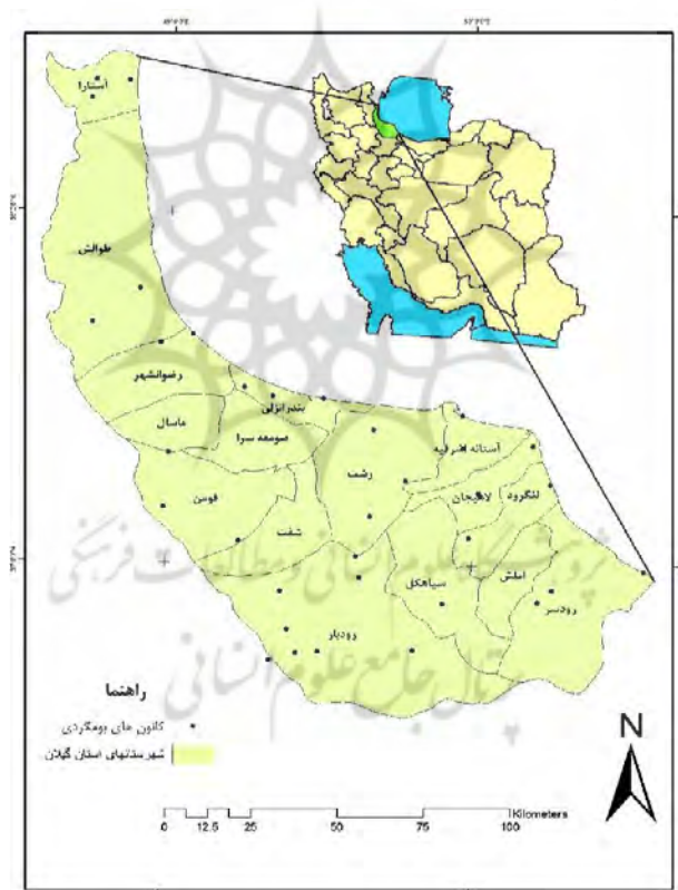
نقشه ۳. پراکندگی کانون‌های بوم‌گردی استان گیلان

توان بالا در حوزه زیستگاه‌های طبیعی، نشان دهنده سرمایه‌های مهم این استان در توسعه بوم‌گردی و گردشگری و جذب افراد مختلف در حوزه فعالیت‌های گردشگری و کارآفرینی در این حوزه است. فضاهاى متعددى به‌عنوان جاذبه‌های بوم‌گردی همراه با خدمات جانبی و عناصر مرتبط در استان گیلان پراکنده شده است. از عوامل مؤثر بر تقاضای گردشگری در مقصدهای بوم‌گردی می‌توان به میزان درآمد گردشگران، ویژگی‌های سنی، جنسی و تحصیلی گردشگران، نوع علایق و انگیزه‌ها، وضعیت اقتصادی، سیاسی و اجتماعی ناحیه تولید گردشگر، میزان دسترسی به اطلاعات مقصد، خدمات مسافرتی، نقش تبلیغات و رسانه‌ها، محدودیت‌های مقصد و مبدأ گردشگری، امنیت، بازار، هدف گردشگری، قوانین و مقررات مبدأ و مقصد گردشگری، سطح توسعه خدمات و زیرساخت‌ها، شرایط اقلیمی، میزان استفاده از فناوری‌های نوین در گردشگری، تعداد گردشگران ورودی به مقاصد گردشگری، هزینه‌های گردشگران، سبک زندگی، نگرش دیدگاه‌ها و ادراک تجربه‌های ملموس و غیرملموس گردشگری و غیره اشاره کرد (حسام و اروجی، ۱۳۹۸).