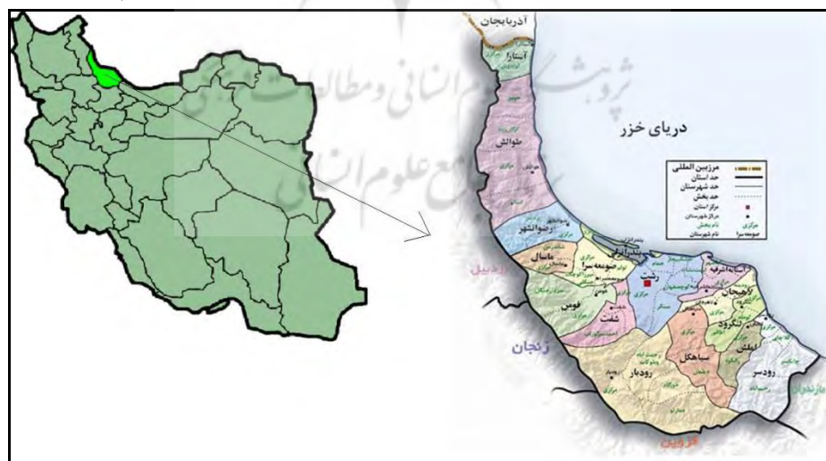
نقشه ۱. موقعیت استان گیلان

این استان با مختصات جغرافیایی 36^{\circ} 34' تا 38^{\circ} 27' عرض شمالی و بین 48^{\circ} 34' تا 50^{\circ} 36' طول شرقی و با وسعت ۱۳۹۵۲ کیلومتر مربع، ۸٪ درصد از مساحت کشور ایران را تشکیل می‌دهد و جمعیت آن طبق سرشماری سال ۱۳۹۵، ۲,۵۳۰,۶۹۶ نفر است. استان گیلان بر اساس آخرین تغییرات در تقسیمات کشوری دارای ۱۶ شهرستان، ۴۳ بخش، ۱۰۹ دهستان و ۴۹ شهر است. این استان همچنین در سال ۱۳۹۵ دارای ۲۹۰۵ آبادی است. گیلان به لحاظ توپوگرافی دارای دو بخش برابر و متمایز از یکدیگر است. بخش هموار آن با نام جلگه گیلان، نواحی شمال غرب، شرق و مرکز استان را در بر گرفته و شامل سواحل دریا و مناطق آبرفتی رودهای منتهی به دریا است. بخش کوهستانی نیز شامل رشته کوه‌های غربی (کوه‌های تالش، ماسوله و...) و شرقی (غرب کوه‌های البرز) است. همچنین منطقه گیلان دارای بارش فراوان است تا جایی که بارش سالیانه شاید به ۱۳۰ سانتی متر هم برسد.