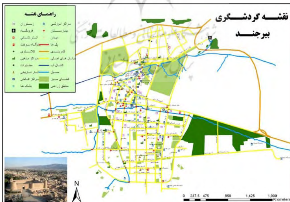
شکل ۲ موقعیت جغرافیایی شهر بیرجند http://www.shora-birjand.ir