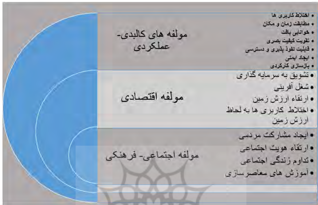
شکل ۱. مدل مفهومی مؤلفه‌های معاصر سازی

۵۲۰ فصلنامه علمی - پژوهشی جغرافیا و برنامه‌ریزی منطقه‌ای، سال یازدهم، شماره دو، بهار ۱۴۰۰ مولفه‌های کالبدی-عملکردی، اقتصادی و اجتماعی - فرهنگی معاصر سازی با رجوع به پانل متخصصان و خبرگان از قرار ذیل است: