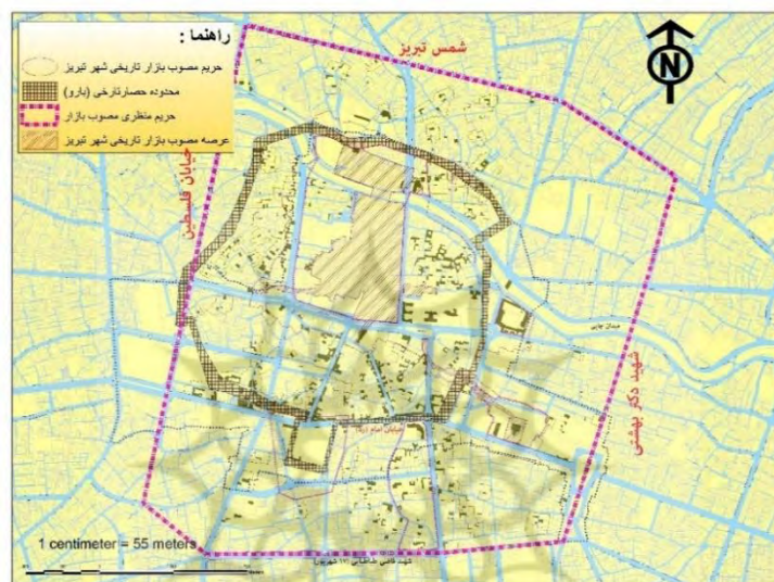
شکل ۲. منطقه تاریخی - فرهنگی تبریز، منبع: مهندسین مشاور نقش محیط، سال ۱۳۹۷

محدوده مورد مطالعه، بافت تاریخی - فرهنگی کلانشهر تبریز می باشد که با ۴۲۱ هکتار وسعت، ۳ درصد از مساحت شهر را در بر گرفته است. این منطقه از شمال به خیابان شمس تبریزی، از سمت شرق به خیابان حافظ، از شمال شرقی به ششگلان و ثقه الاسلام و از جنوب به خیابان ۱۷ شهریور جدید و از جنوب غربی به شریعتی و از جانب غرب به خیابان فلسطین محدود می شود، جمعیت بافت تاریخی - فرهنگی کلانشهر تبریز بر اساس سرشماری سال ۱۳۹۵ برابر ۲۹۳۸۴ هزار نفر می باشد.